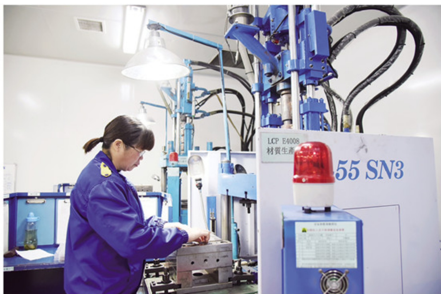
在品翔电子元件(漳州)有限公司内,工人们在调试即将批量投入生产的新能源汽车配件。

2018年,南靖239家规模以上工业企业累计完成工业产值473.3亿元,现价总产值增长15.2%。