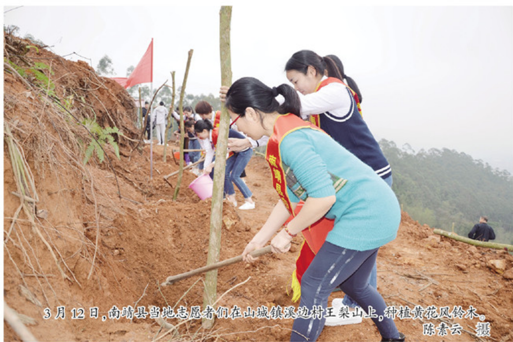
3月12日,南靖县当地志愿者们在山城溪边村王梨山上,种植黄花风铃木。

由此可见,企业要想成功转型,还需根据自身实际,适时适地。此时,当地政府部门的介入就显得尤为重要。这就需要站在企业的角度,匹配灵活的政策,为企业参谋转型方向。同时,还需鼓励企业争取最大的政策优惠,引导企业往最稳妥的市场发展,共同探索改革方向。如此,与民营企业同呼吸、共命运,为民营企业强动力、促发展。