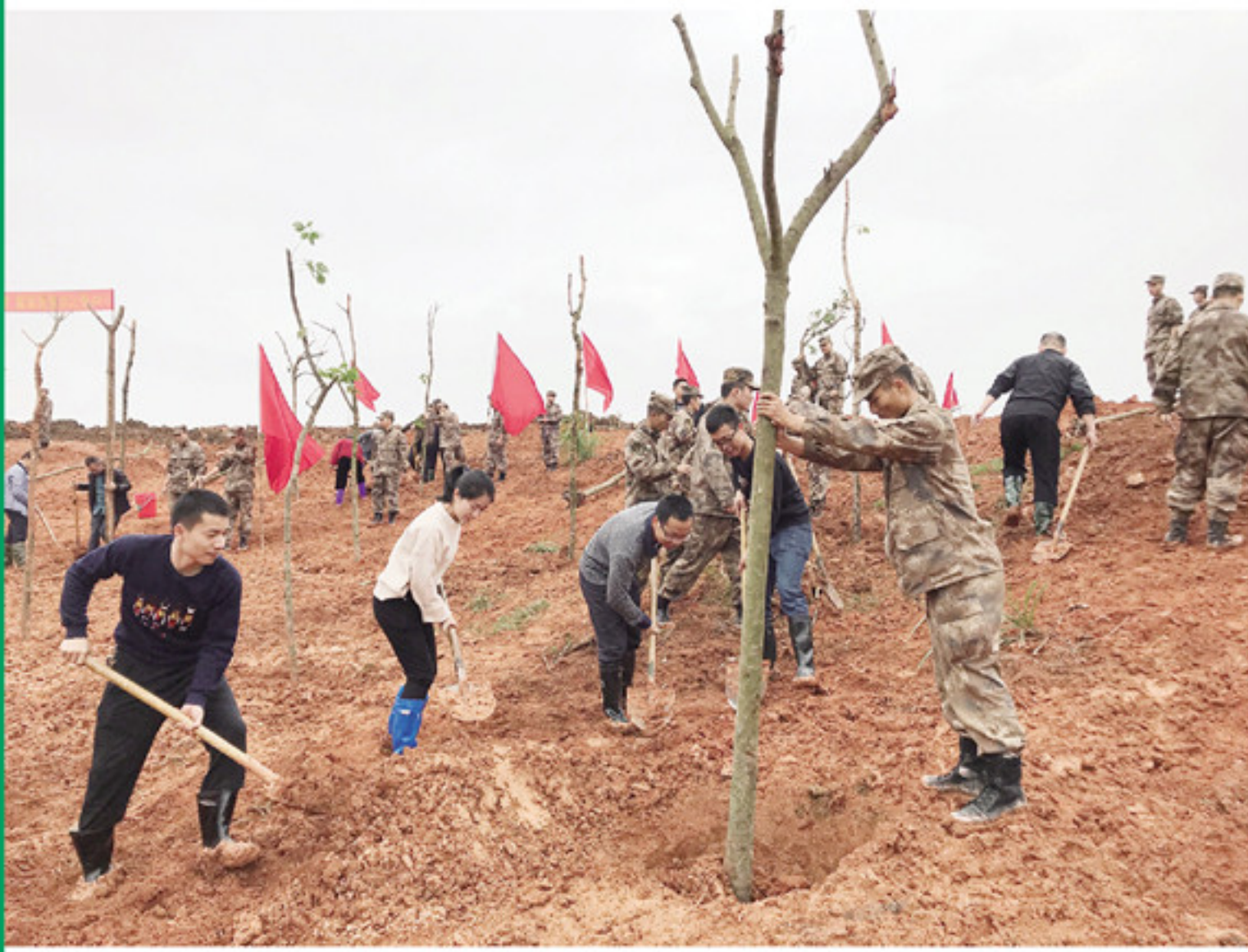
上图:靖城镇领导干部、草前村两委、驻漳某部官兵正在部队植树基地植树。 下图:丰田镇党委政府组织干部职工、各村护林员在保林村顶洲义务植树。