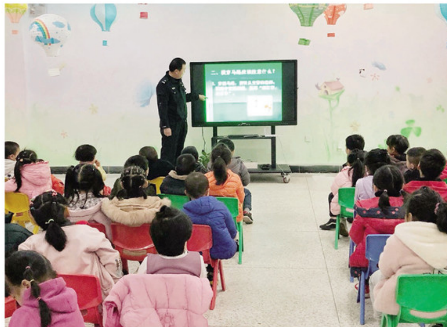
民警正在为小朋友宣讲“交通安全伴我行”知识

本报讯(通讯员 蔡淑娟 陈旺根 文/图)近日,南靖县公安局南坑派出所民警走进南坑中心幼儿园,为小朋友开展“交通安全伴我行”知识宣讲活动,以提高幼儿的交通安全和文明出行意识,切实做好幼儿交通安全宣传教育工作。