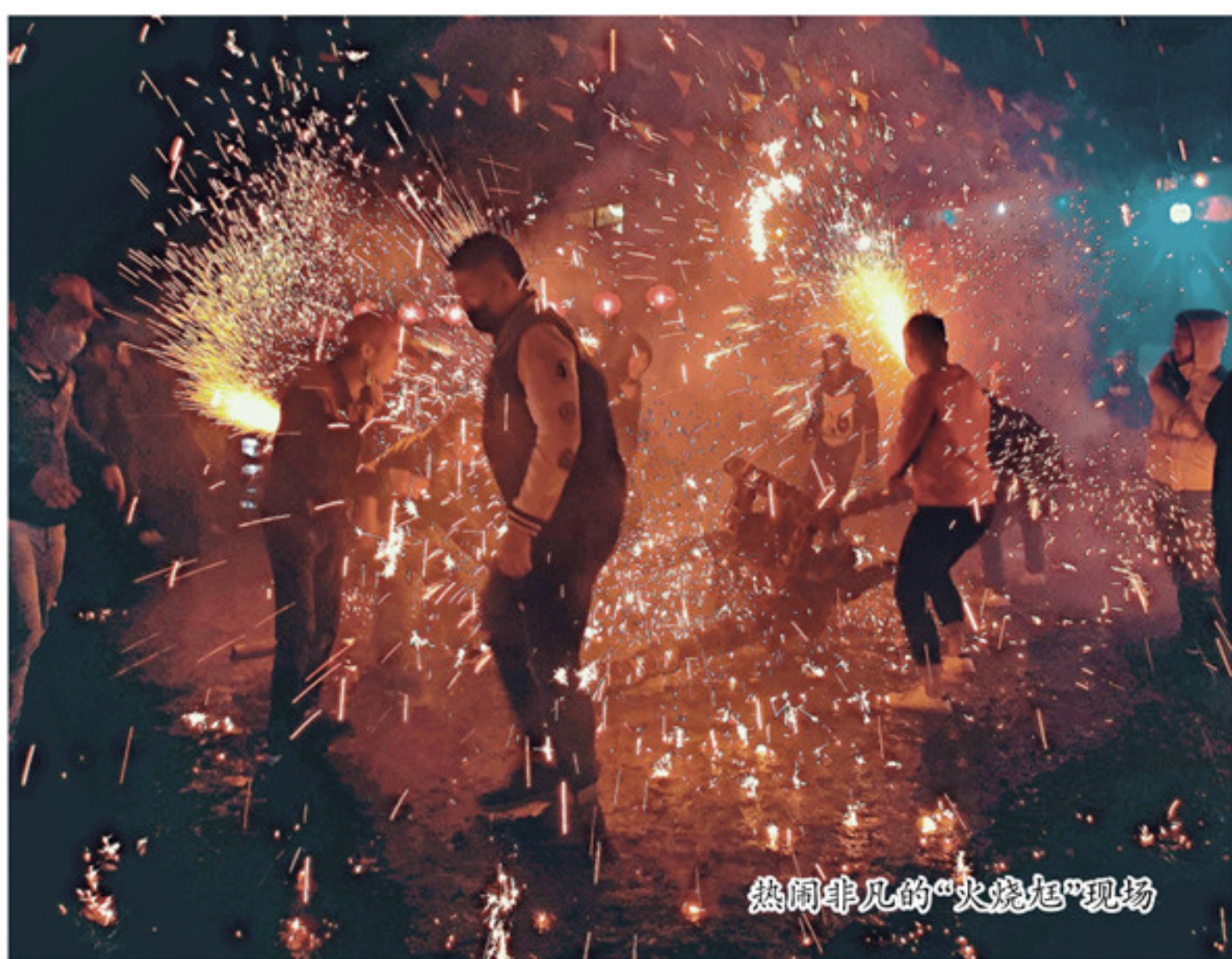
热闹非凡的“火烧起”现场