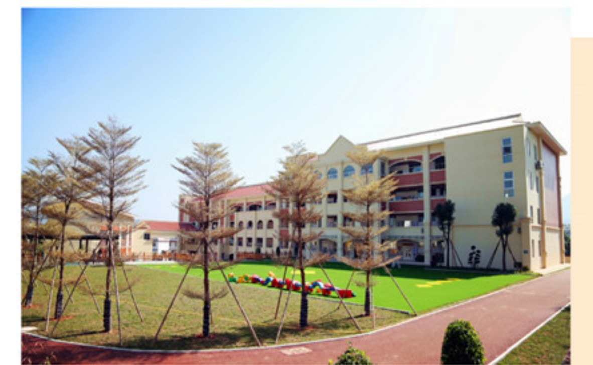
山城镇第二实验幼儿园

2018年正值南靖土楼申遗10周年,在这10年里,南靖土楼这一品牌所带来的旅游经济效应推动本地大批富余劳动力实现就地转移就业,本地青年们由外出务工纷纷转变为返乡就业。路更宽了,城更美了,一个生机勃勃的新南靖正迈步走来。