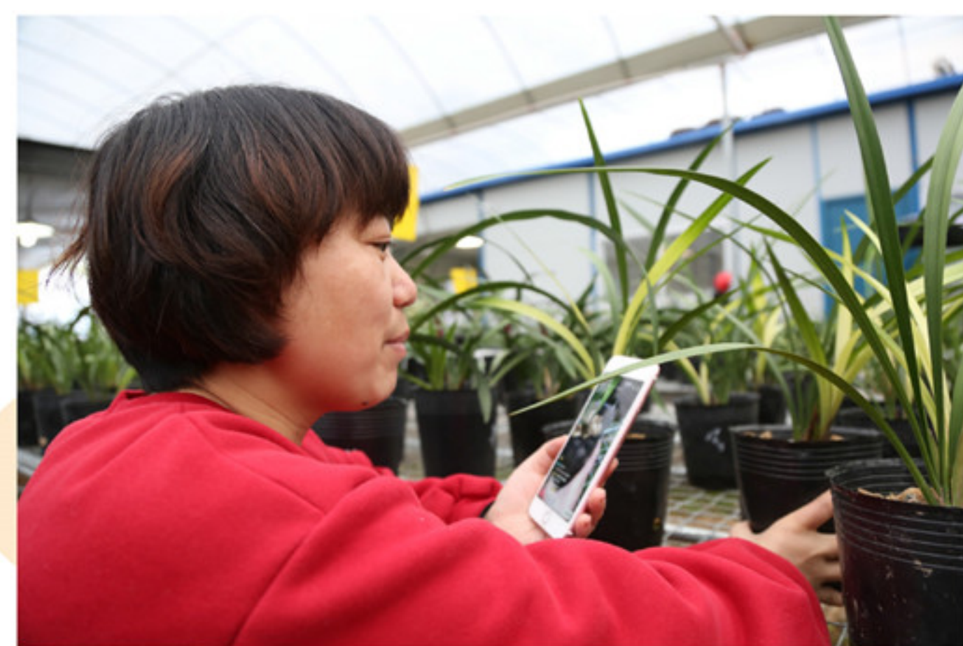
在青轩兰场,主播“兰花风”正在为在线粉丝挑选、介绍兰花。

新平台的营销新玩法,不仅带来了交易额的增长,更为南靖兰花品牌触达消费者提供了全新的途径,增强了客