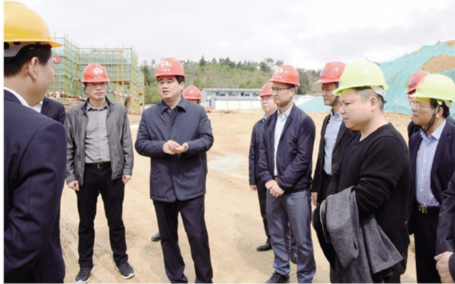
沿线两侧整治工作,统一好沿线房屋立面,拆除违法无序的广告牌,清扫清运乱堆放的杂物及垃圾,切实改善公

在书洋镇上田村宗元旅游项目及梅林半山谷专营店、通美云水谣庄园项目等地,县委书记黄劲武详细了解了项目建设进展情况,要求相关单位要做好项目的规划设计工作,提升项目品味,做到土楼景区相和谐;要抢抓时间节点,合理安排工期,切实加快项目建设速度。同时,梅林、书洋、船场、南坑等相关镇村要积极开展美丽乡村建设,集中力量抓好山梅公路