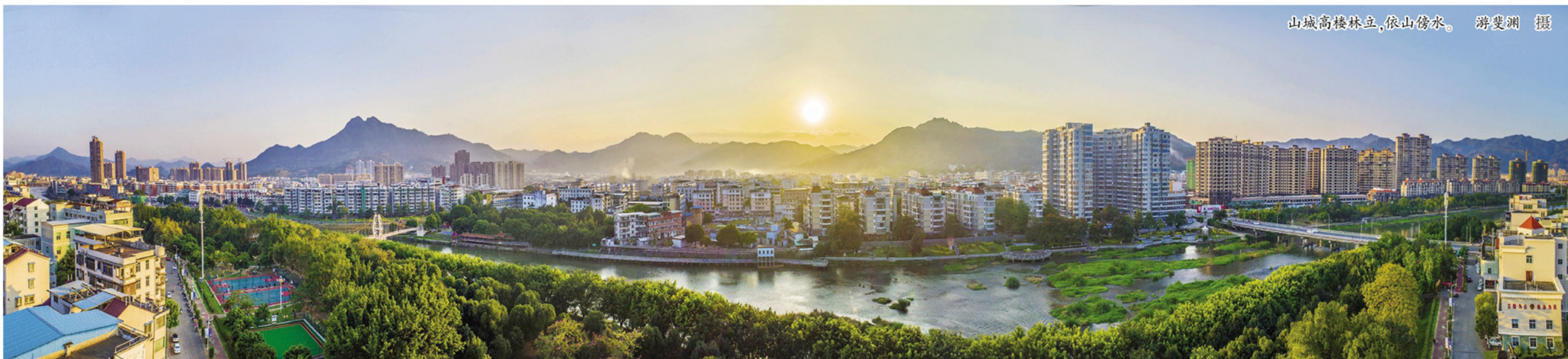
山城高楼林立,依山傍水。