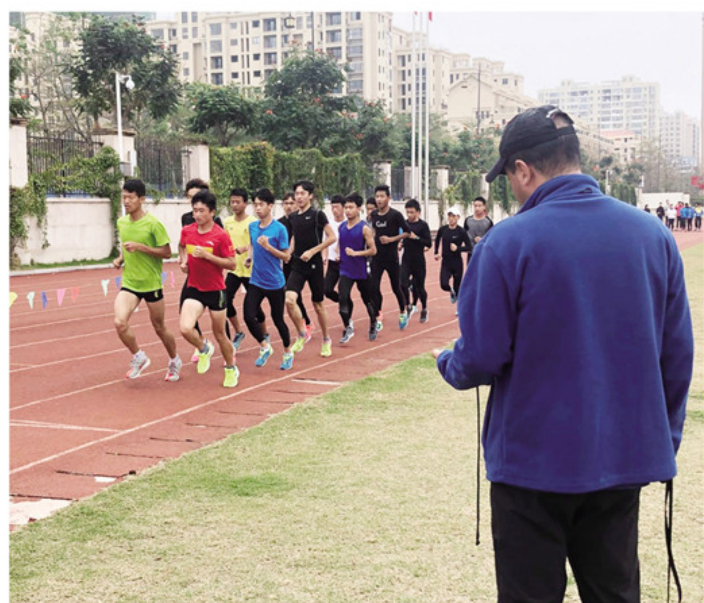
外省运动员正在南靖县体育馆操场训练