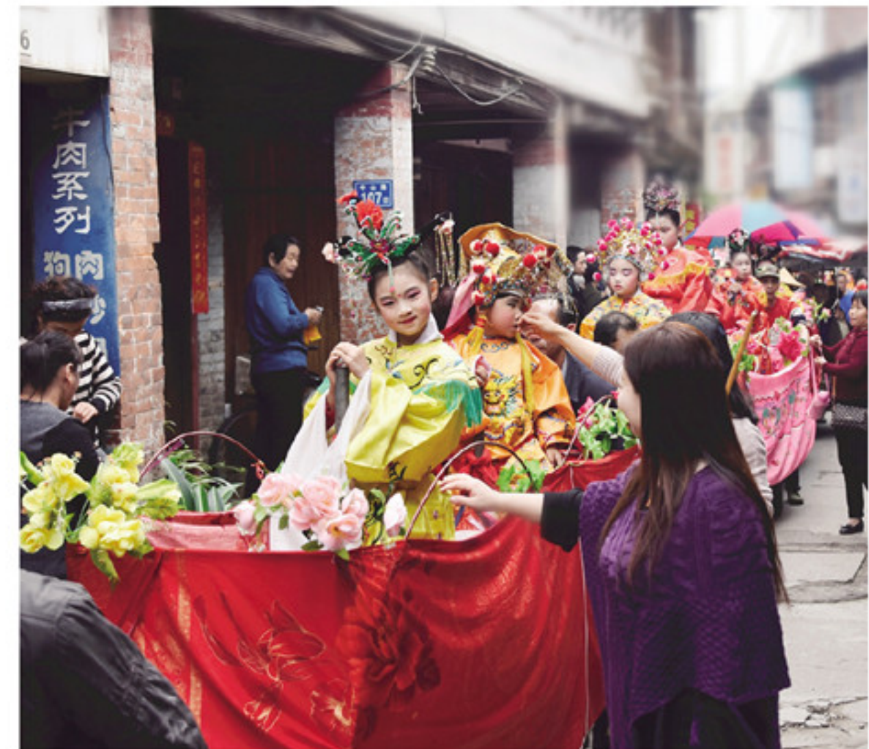
龙艺队伍浩浩荡荡地在县城的大街小巷

本报讯(记者 庄伟杰 文/图)2月19日,正值元宵佳节。在震耳欲聋的鼓乐声中,南靖山城武庙大型龙艺队伍浩浩荡荡地走向县城大街小巷。