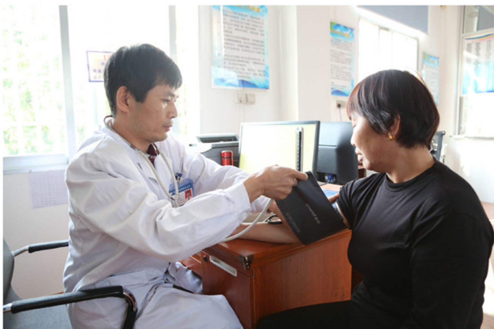
靖城镇村级公办卫生所

近日,南靖土楼旅游公路“山海公路”全线亮灯,为这“一条公路、两边风景、四季有花、四季常青”的公路点亮了全新的风景。