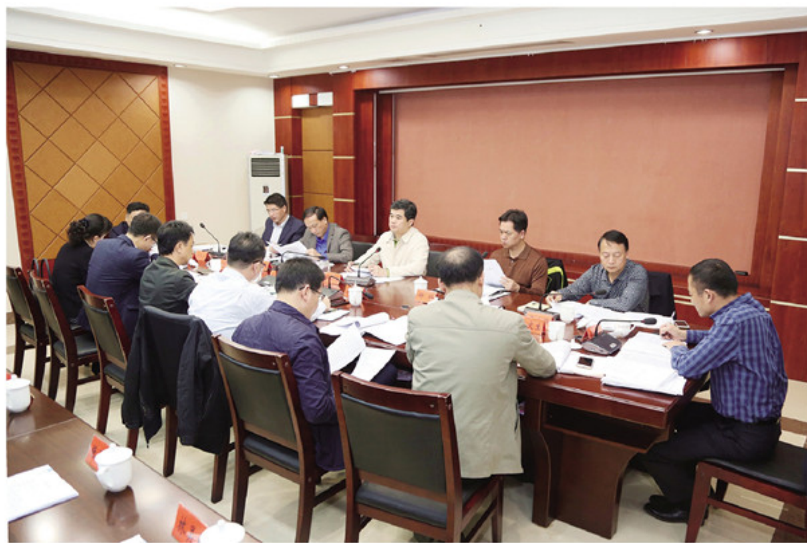
会议传达学习贯彻《中华人民共和国公务员法》《中国共产党农村基层组织条例》和习近平总书记重要文章

会议传达学习贯彻习近平总书记在中央政法工作会议上重要讲话精神和《中国共产党政法工作条例》主要内容。会议指出,要深刻领会会议精神,增强“四个意识”、坚定“四个自信”,做到“两个维护”,切实增强做好新时代政法工作的政治责任感,统筹推进各项重点工作,努力建设一支素质过硬的政法队伍。