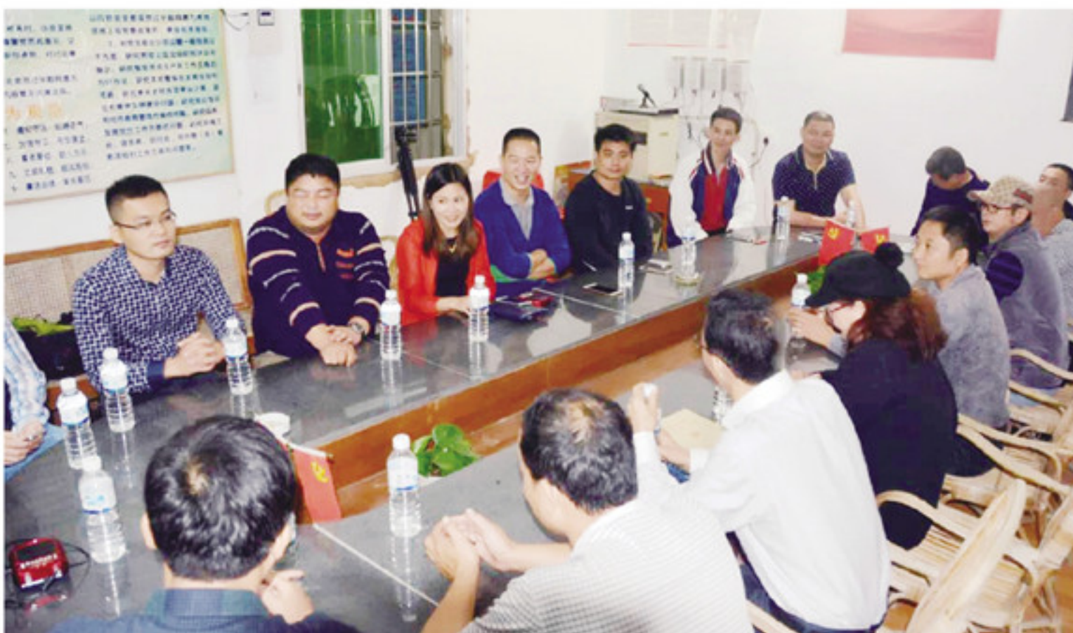
石桥村村两委组织乡贤与村民开展座谈,探讨石桥村的发展方向。

走进南靖县南坑镇金竹村,抬眼望去,周边茶山浓郁的绿意仿佛要漾出山头,轻柔的山风吹在脸上,让人陶醉。金竹村位于南靖县西部,是南坑镇最偏远的山村,也是九龙江西溪的发源地。金竹村耕地面积56亩,茶园面积2200亩,种茶历史悠久,全村经济收入以茶叶为主。