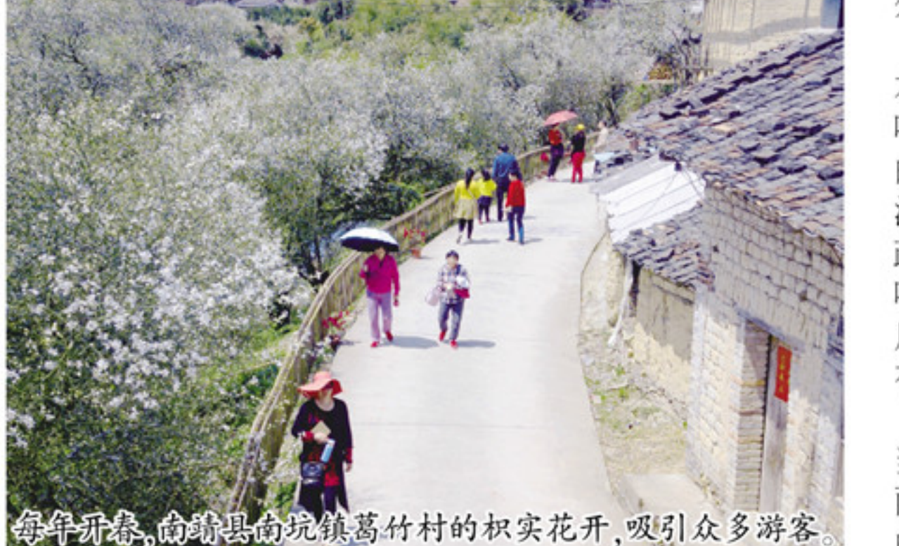
每年新春,南靖县南坑镇葛竹村的枳实花开,吸引了众多游客。