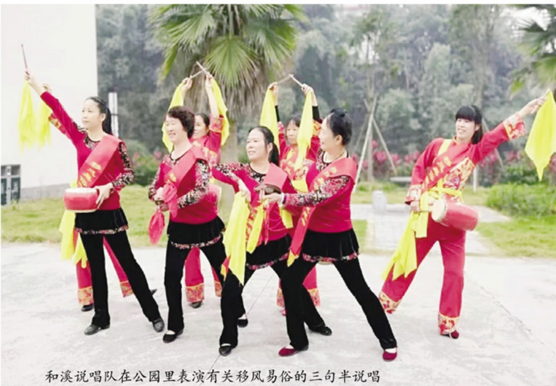
和溪说唱队在公园里表演有关移风易俗的三句半说唱

本报讯(记者 吴丽娜 福林 文/图)近日,在南靖县和溪文化公园,经常有身穿统一演出服装的宣传队表演有关移风易俗的三句半说唱,受到当地群众的热烈欢迎。