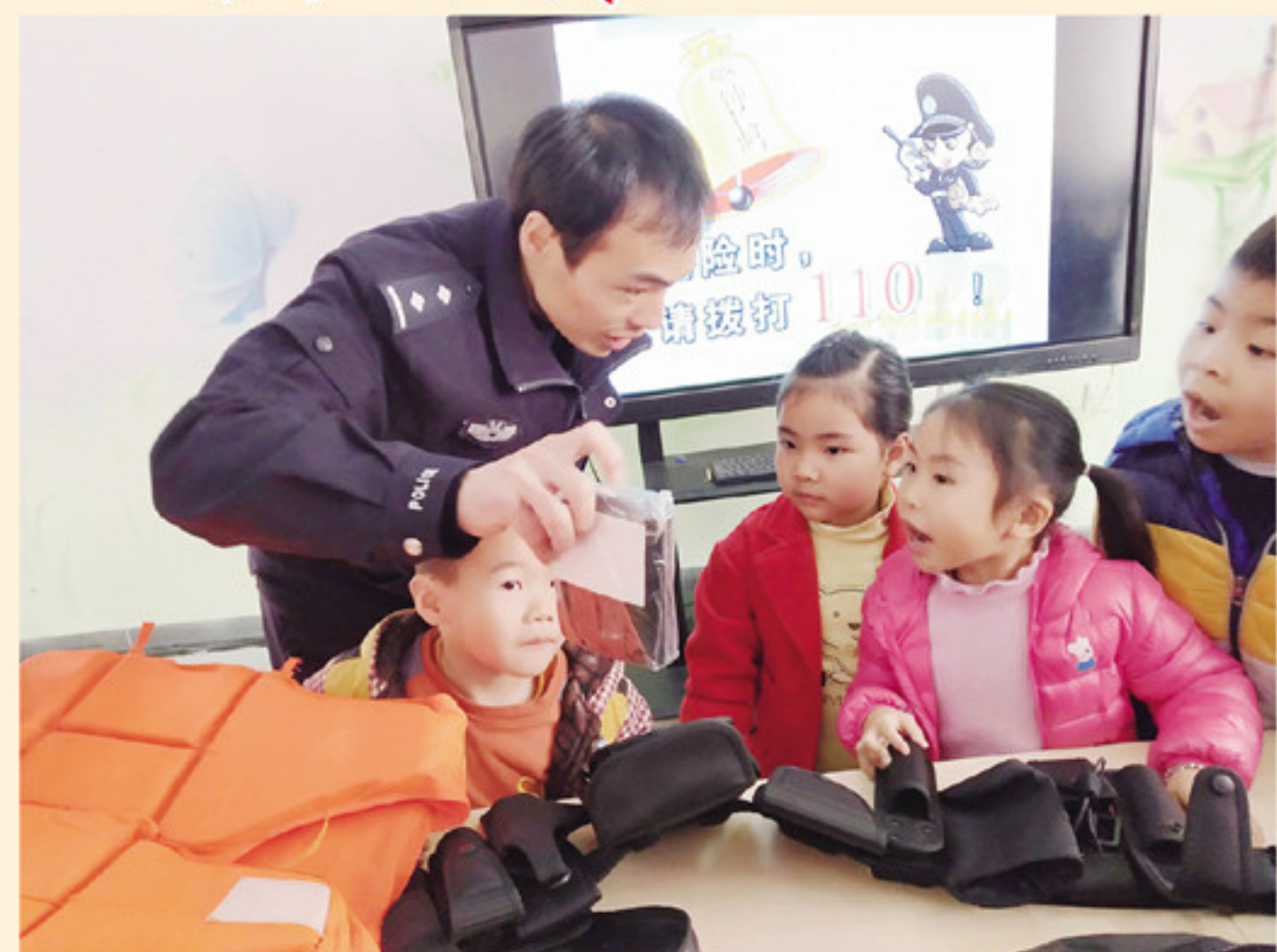
民警向幼儿园小朋友展示执法执勤装备,介绍相关警务知识。

“110”这一数字原来只是单一的报警电话,现如今已然成为公安干警的另一个代名词。1月10日是全国第33个“110宣传日”,为进一步加强警民交流互动,本着让幼儿走近民警,培养幼儿自我保护意识,感受正义、了解警察,南靖县公安局南坑派出所民警走进南坑中心幼儿园,开展“守护你我他”110宣传主题活动。 活动一开始,民警就用通俗易懂的语言告诉小朋友们“什么是110”以及“110具体是做什么的”,让小朋友们的日常工作。随后,民警向小朋友们示范怎样向110报警求助,民警还现场模拟了警情,让小朋友在模拟情境中真实体验,调动小朋友们参与学习安全保护意识的积极性。在模拟过后,民警跟小朋友们强调,遇到110报警电话,不报假警。因为110报警电话是他在遇到紧急情况时的重要求助方式。 在活动期间,民警还向小朋友们展示了执法执勤装备,介绍每个装备的用途和相关警务知识,让小朋友们近距离体验,有效地提高了小朋友们的法制安全意识。 对于警察叔叔的到来,小朋友们表现出了极大的热情,对于警察叔叔的提问也是积极参与,通过这样的近距离接触体验,能让孩子们加深对110、对法制常识的认识与理解,从而提高孩子们的自我保护能力与自救能力,教育一个孩子,带动一个家庭,影响整个社会。