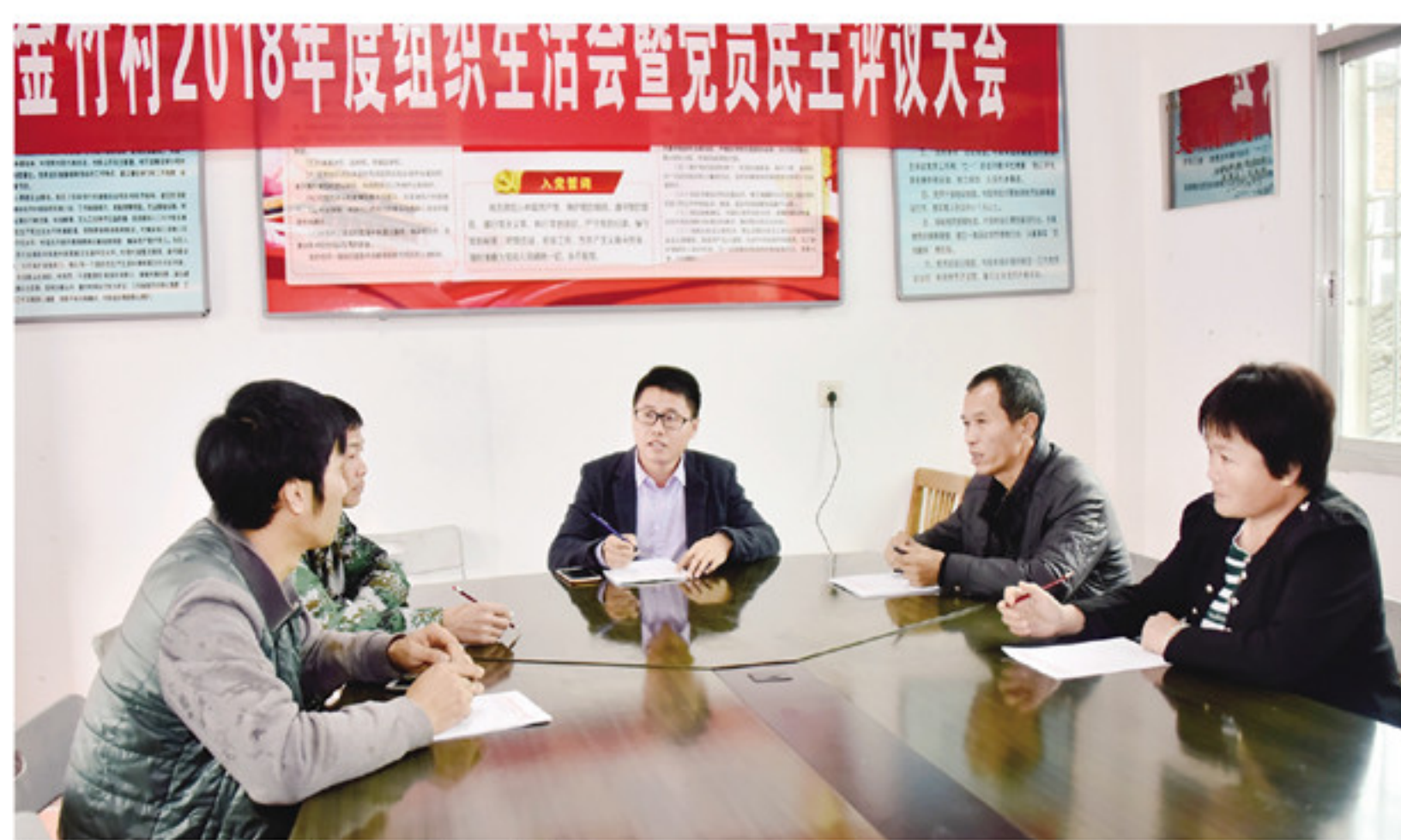
南坑镇金竹村召开支部会议

护美乡村绿水青山,守牢农民金山银山,从乡风文明到乡村治理,从生活富裕到生态宜居,乡村振兴离不开乡贤的影响力。通过制定村规民约,推动文明乡村、朴实乡风的形成,这是保护乡村振兴生态环境一个很重要的环节。