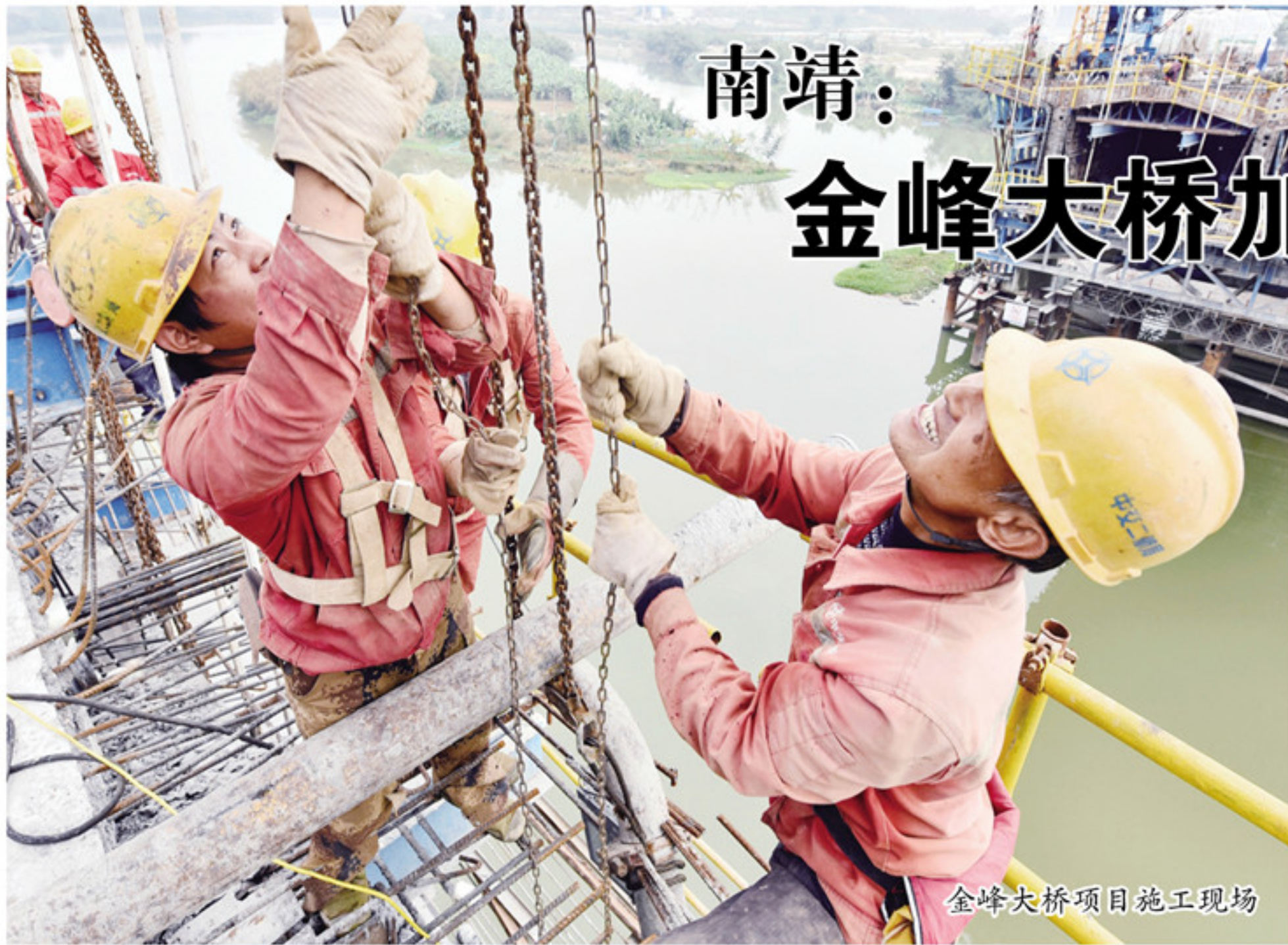
金峰大桥项目施工现场

本报讯(记者 游雪慧 庄伟杰 通讯员 陈智琛 文/图)1月14日,在南靖县靖城镇廊前村的世界跨径最大、最长廊桥——金峰大桥工程项目施工现场,400多名工人在加紧建设。 据介绍,金峰大桥右幅计划在年底进行合龙,北江滨部分连续箱梁已经进行桥面护栏施工,南江滨部分连续箱梁也在稳步推进,南北引桥连续箱梁施工预计于6月可全部完成,进入全面护栏施工。 据悉,金峰大桥工程项目全长1.95公里,设置双向六车道,项目总投资9.5亿元。该项目建成后,漳州市区到南靖县靖城新区只需要10分钟,方便了两地老百姓出行。