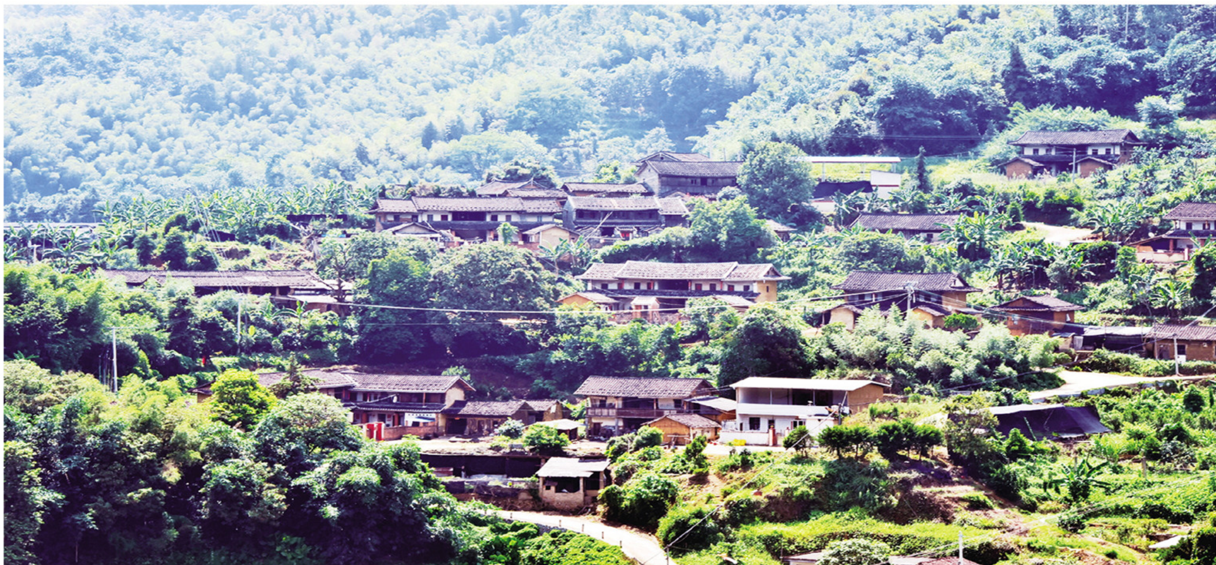
南靖县南坑镇南高村是革命老区村、市级文明村,环境优美,人杰地灵,乡贤辈出。

在我国快速发展的城市化进程中,大量农村人融入城市发展大潮,经济社会结构发生深刻变化。一批农村人通过发挥勤劳智慧取得了成功,成为乡亲们眼中的乡贤。而“乡贤”二字又饱含着乡亲们的期待,乡村振兴需要凝聚各方力量,乡贤作为扎根乡村社会土壤的能人善士,既是区域经济发展的有力推动者,也是服务乡村振兴战略不可或缺的重要力量。