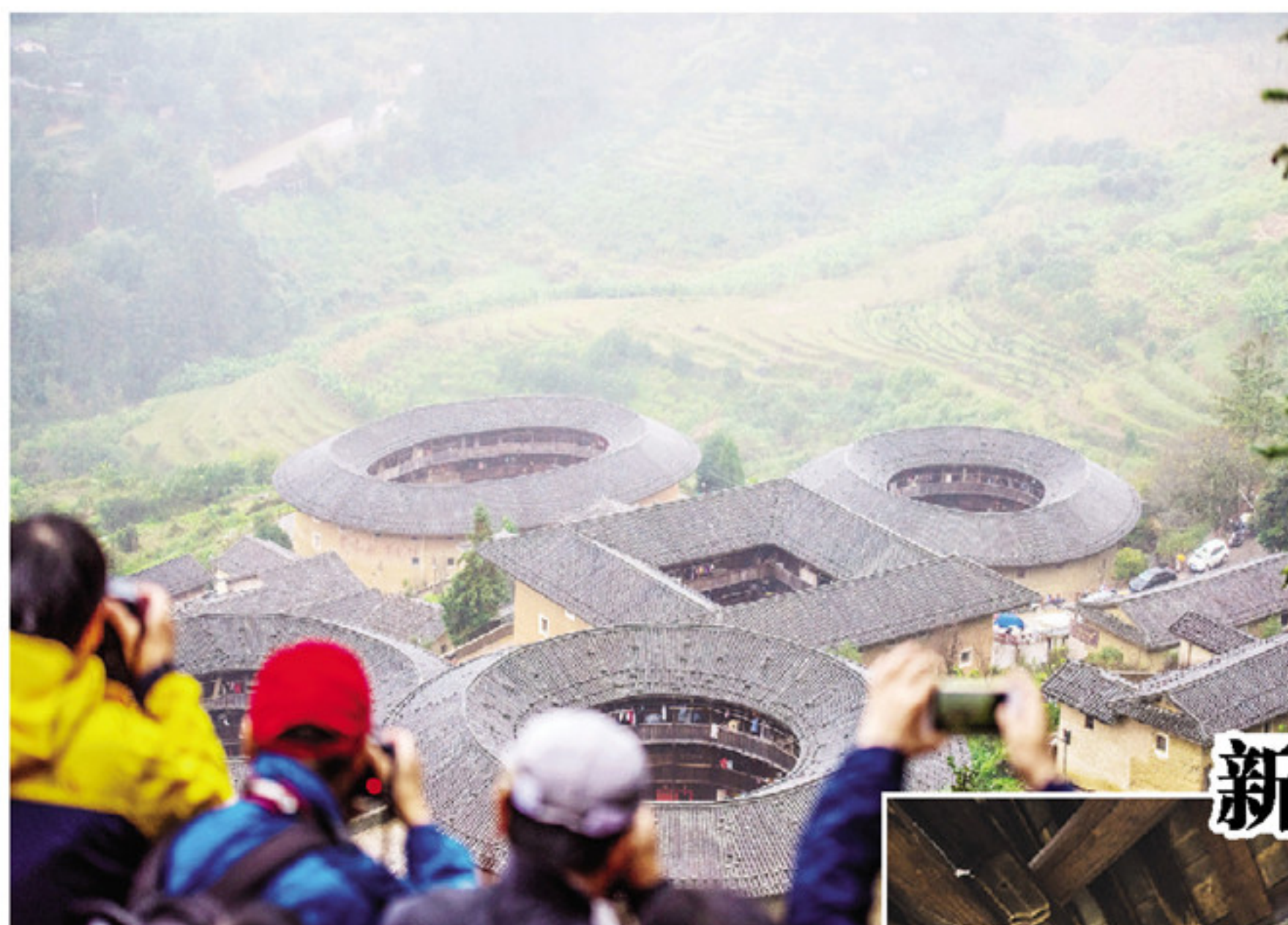
▲“四菜一汤”吸引摄影家前来采风