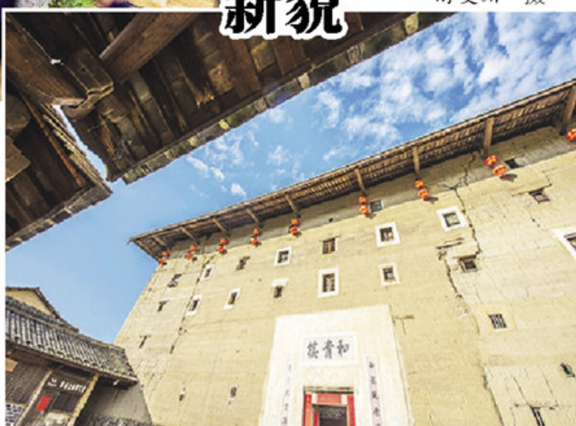
▼和贵楼新貌

本版图文除署名外由闽南日报记者 徐镜正 见习记者 杨瑞 记者 游雪慧 采写、拍摄