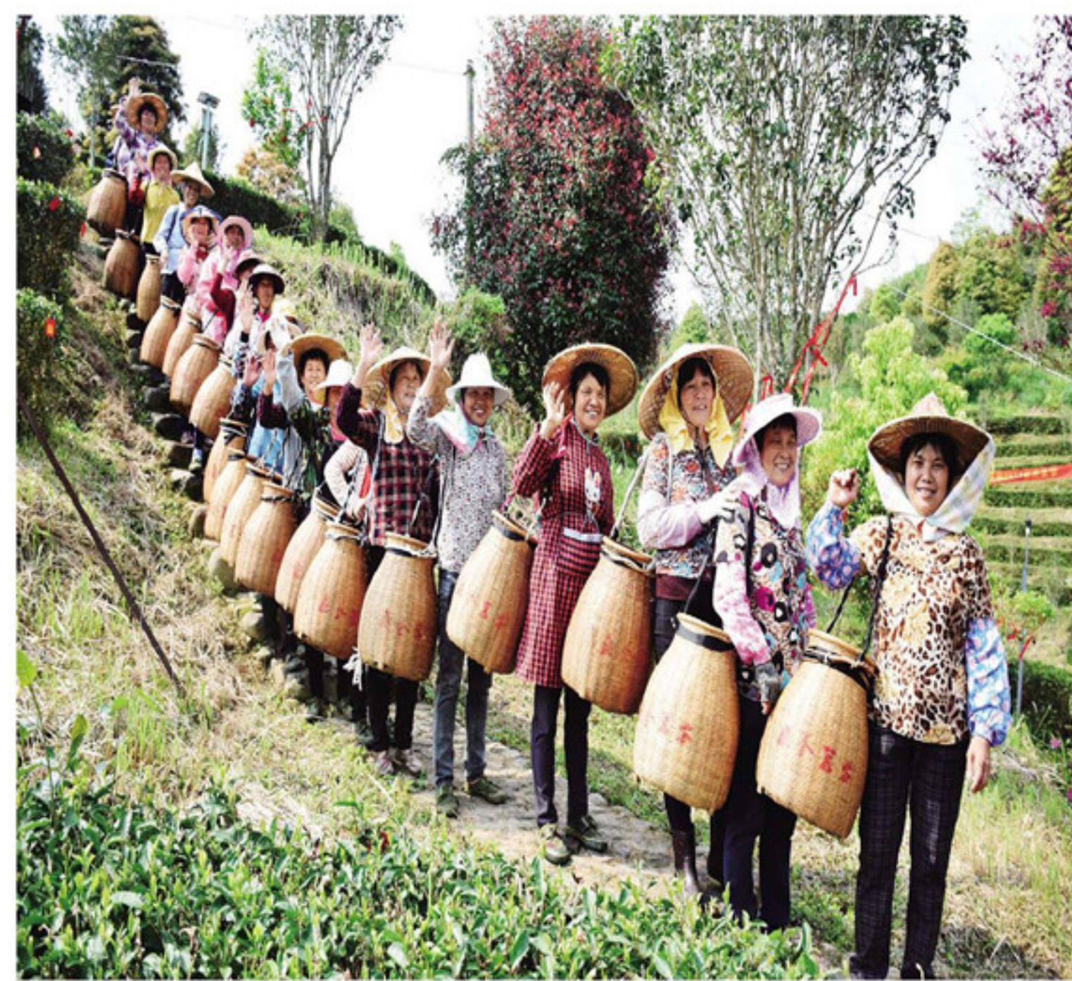
茶农在南靖县梅林汇全茗茶的生态有机认证茶园采茶

近年来,南靖全力构建产业融合、集聚集群的新经济,初步形成了新型工业、现代农业、生态旅游和新兴服务业协同发展的产业体系。产业发展不仅为全域旅游提供了有力支撑,也为三产融合奠定了坚实基础。今年上半年,全县238家规模企业实现产值244.84亿元。下阶段,南靖将用好惠企政策,积极引进优质项目,做好政银企对接,破解企业融资难题,营造良好营商环境,吸引更多外地企业到南靖投资兴业。