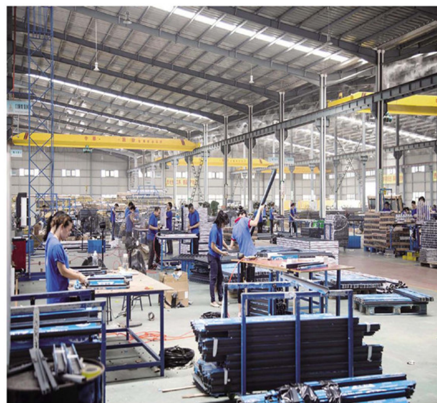
全省最大幕墙公司中德幕墙厂房内,工人们正忙碌生产。