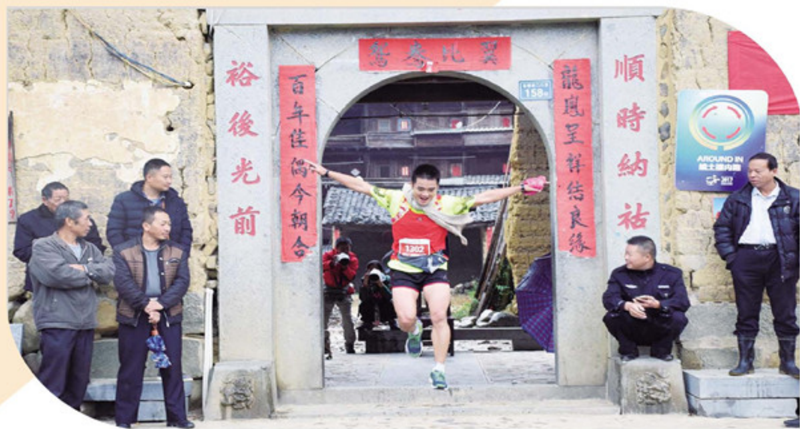
▼土楼马拉松选手跑出顺裕楼