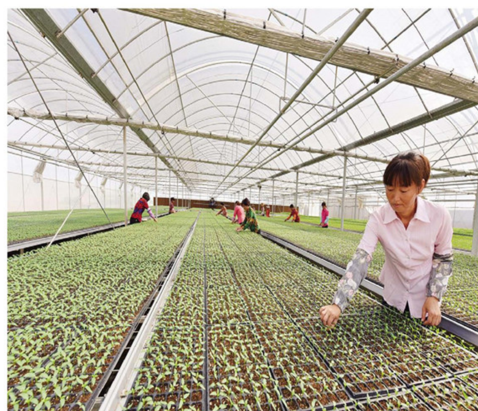
百汇绿海蔬菜农业科技生态园