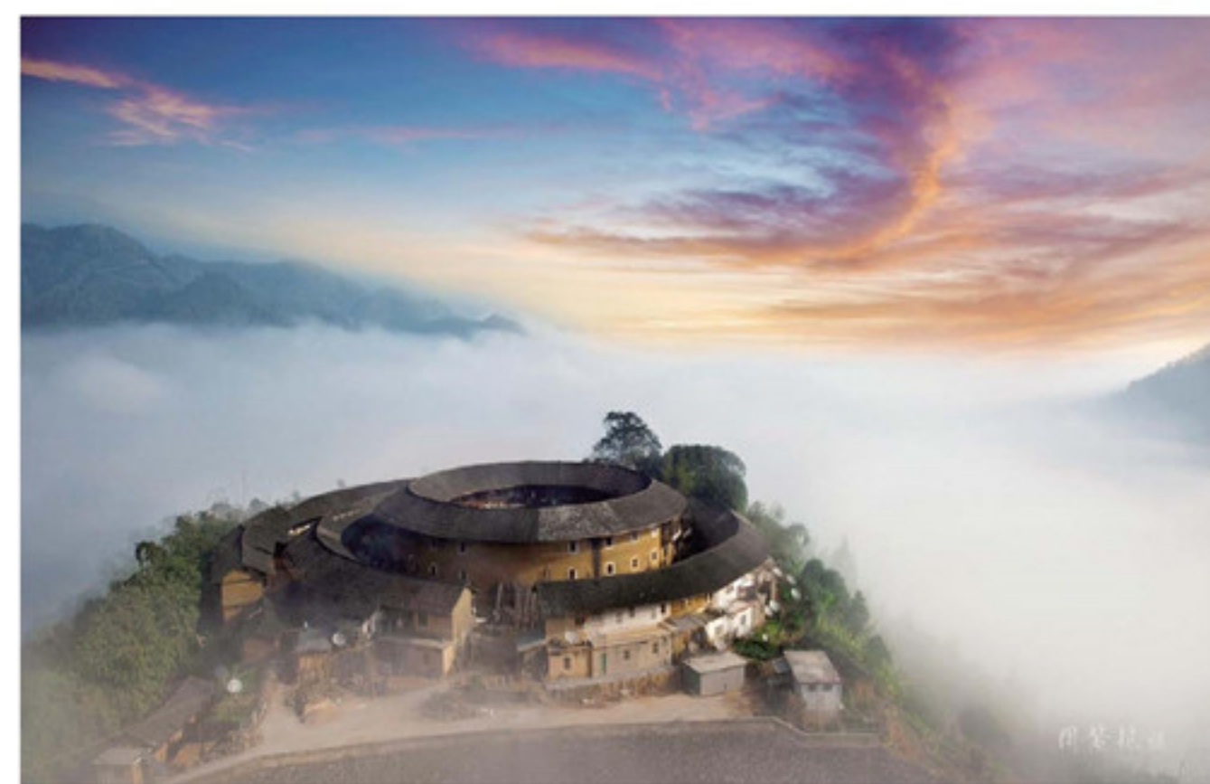
▲南靖县船场镇甘芳村大坪楼