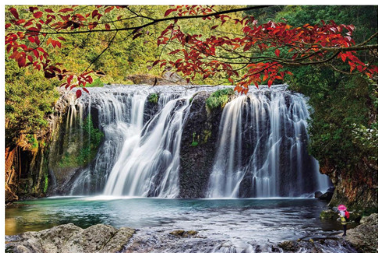
南靖县船场镇树海瀑布