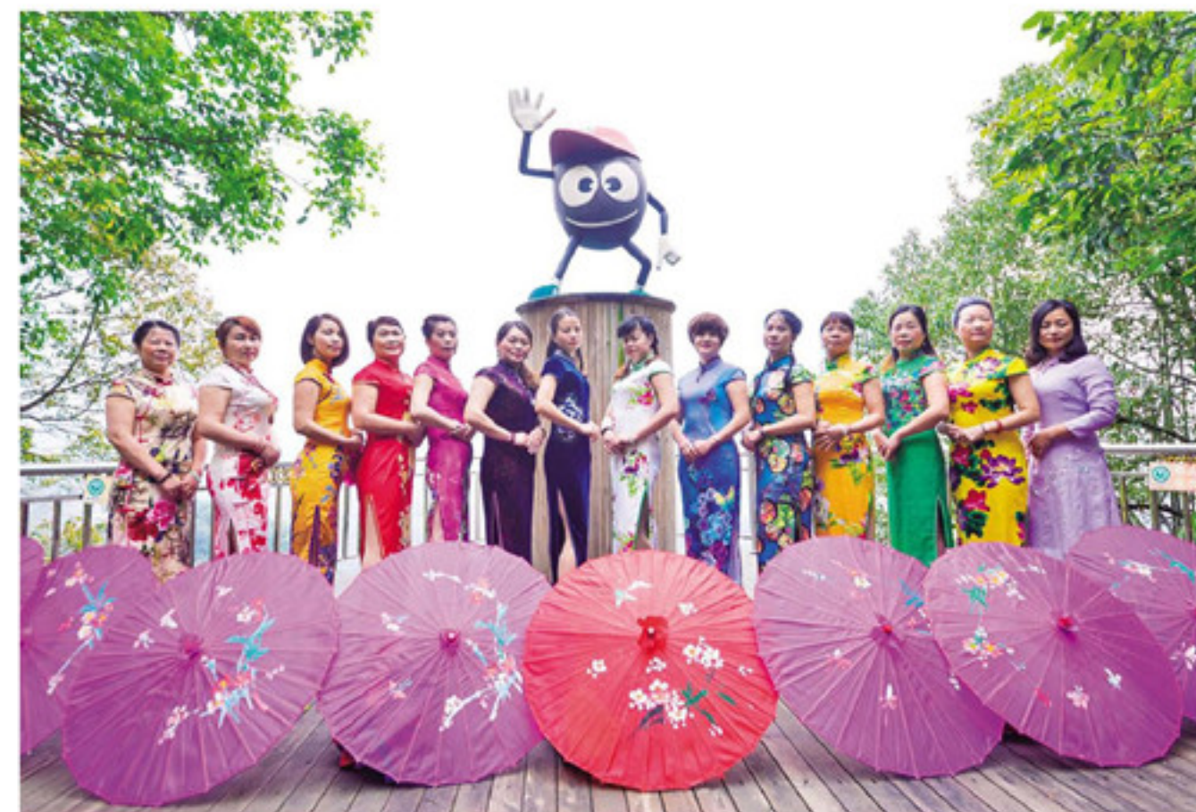
▲南坑咖啡园南高旗袍秀