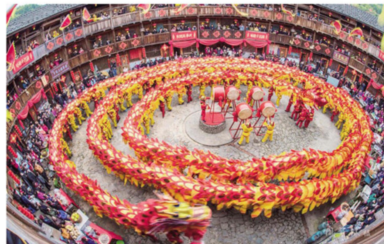
▲南靖县书洋镇田螺坑文昌楼里的“中华龙”

本报讯(记者 庄伟杰)如今,旅游发展,不再是前从的“打造某景区”的概念。真正值得人们远道而来,放松身心旅游的地方,应该是处处是景、时时见景、人为景、事事皆景的地方。南靖县作为省级全域旅游示范县,在全域旅游建设和功能布局中,深入挖掘本地各类优势资源,打造升级版“旅游+”,为广大旅客交上一份满意答卷。今年1-8月份,全县旅游接待人次342.4万人,同比增长19.5%,旅游总收入264580万元,同比增长37.5%。