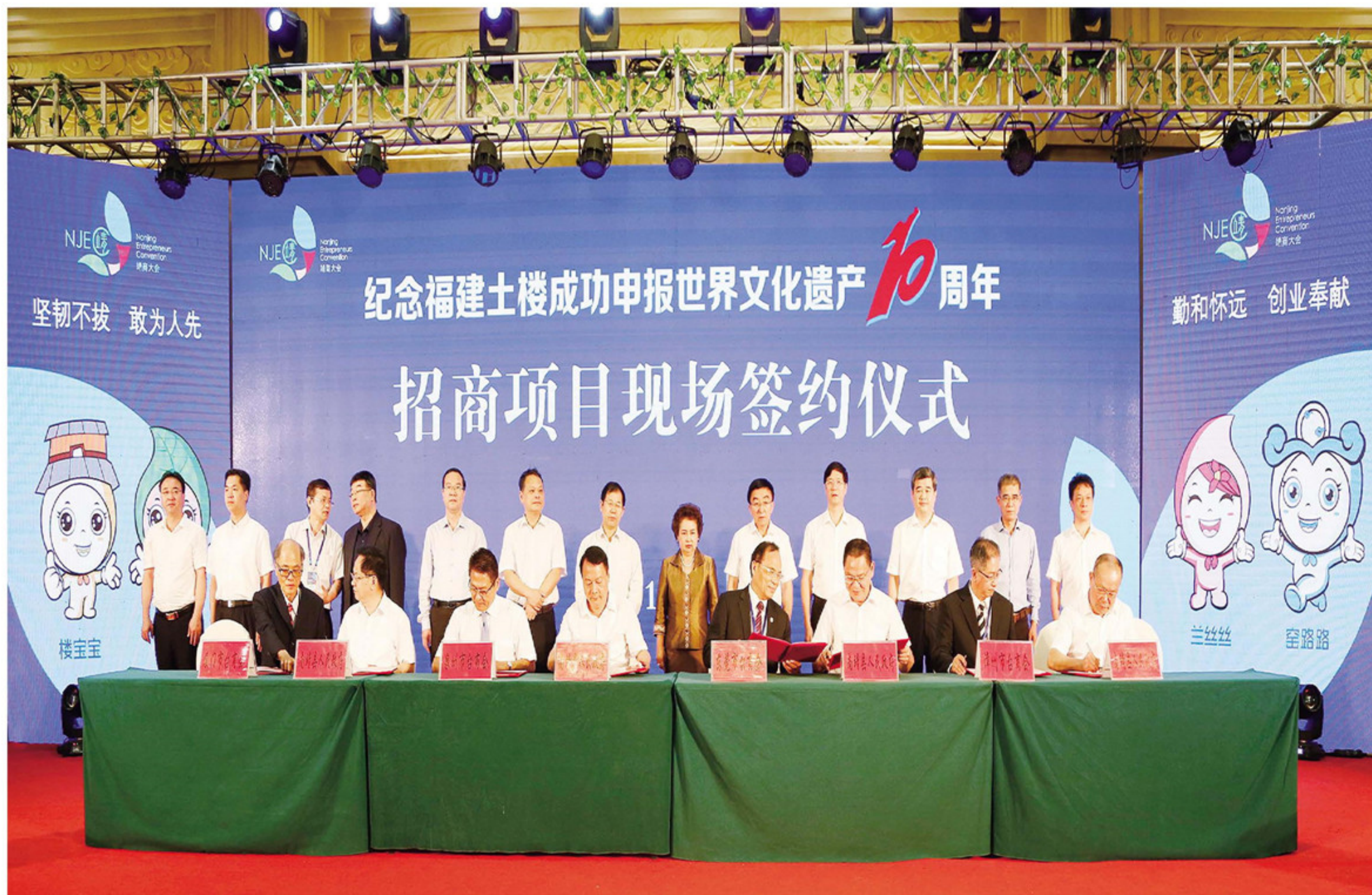
2018年7月6日,在纪念福建土楼申遗成功十周年南靖县全域旅游暨首届靖商发展大会上,南靖举行招商项目现场签约仪式。