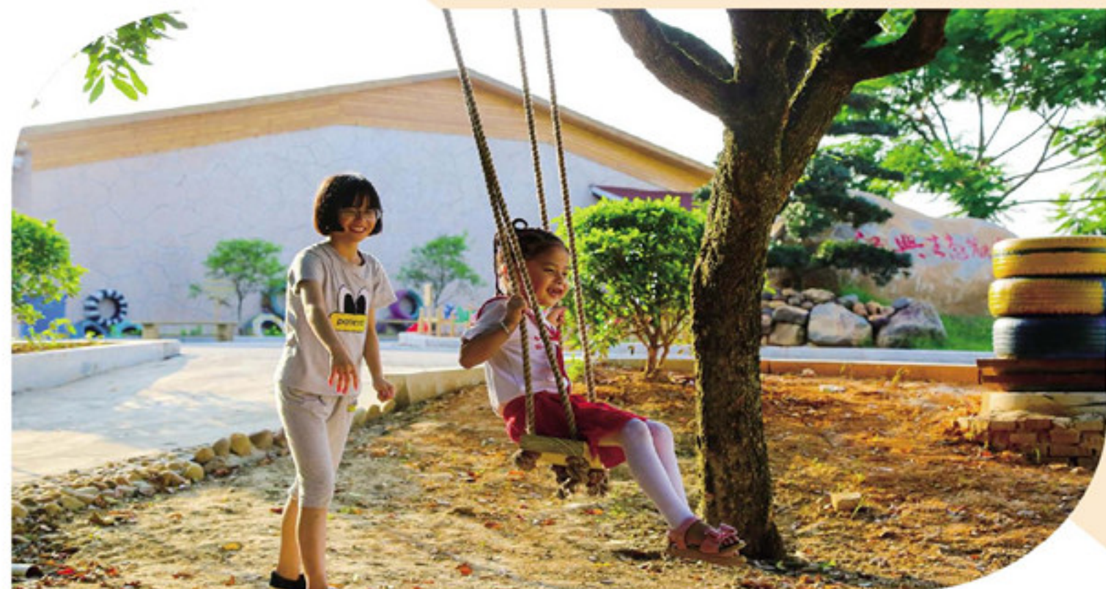
▼源兴生态农业观光园里的欢乐时光