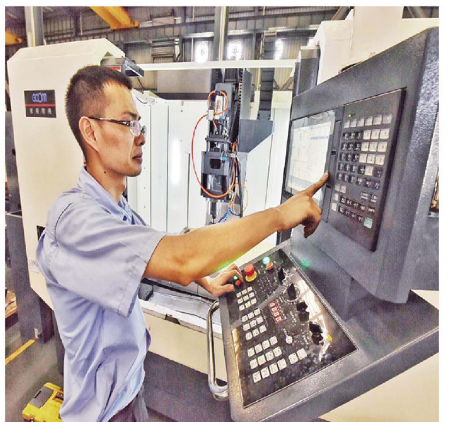
在东刚精密机械有限公司生产车间内,技术员正在运行智能数控加工中心机。

本报讯(记者 张梦帆)9月8日,第二十届中国国际投资贸易洽谈会在厦门开幕。南靖在当天下午举办的2018福建省现代服务业专场对接活动中,现场签约了南靖——绿世界生态农场项目,总投资2.2亿美元。该项目将通过经营休闲农业,从农产品直销、游客休闲体验等方面,增加