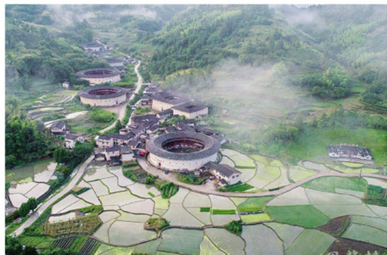
南靖县书洋镇河坑村