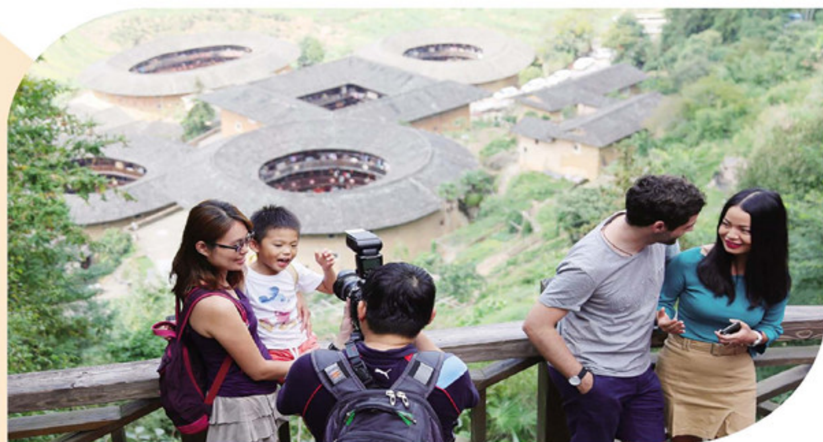
▲来自西班牙的游客跟田螺坑合影