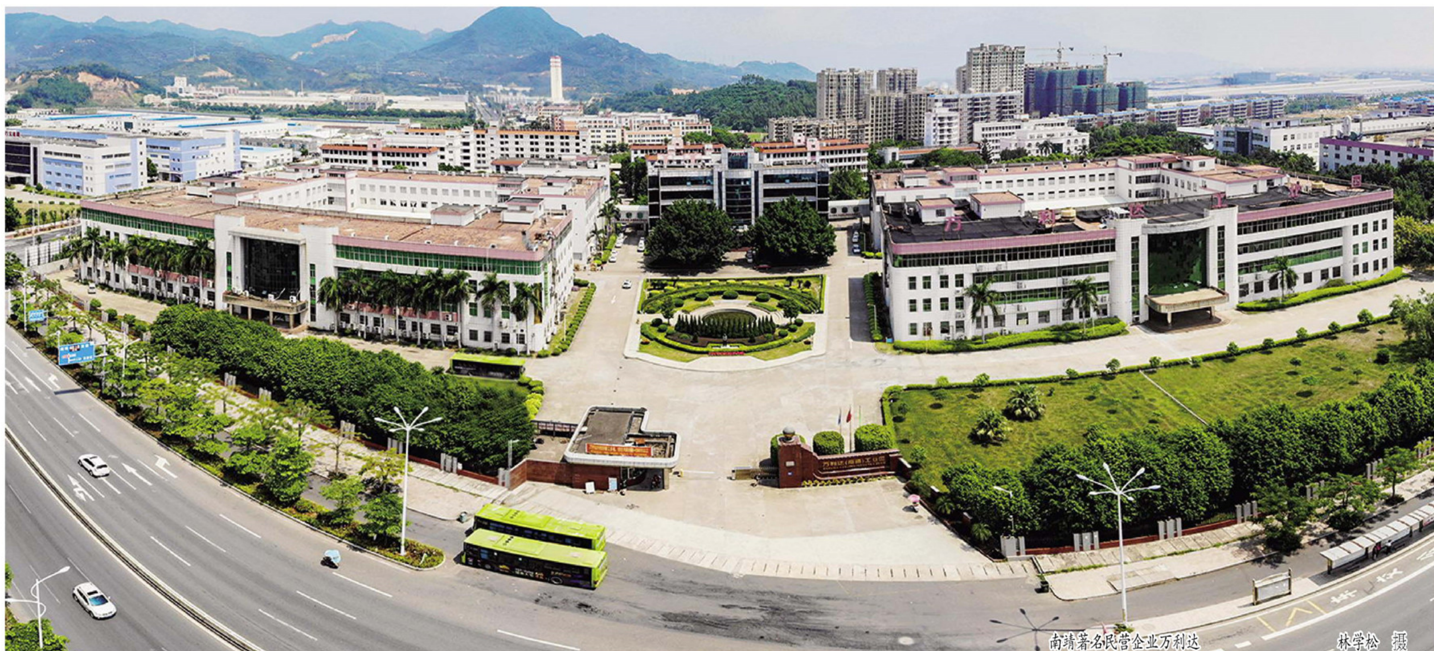
南靖著名民营企业万利达