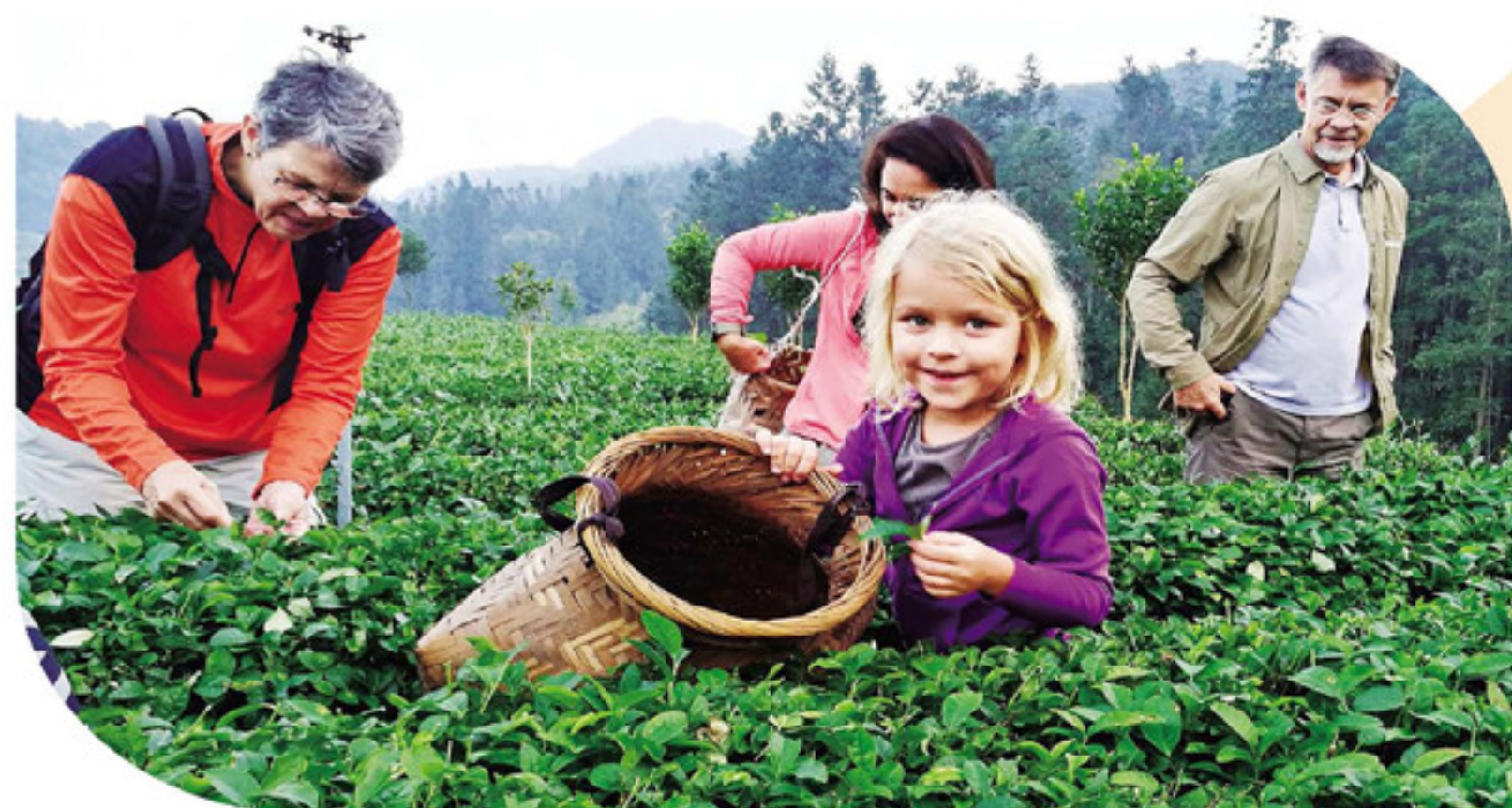
▲省级休闲农业示范点树海瀑布茶庄园迎来一群西班牙游客。