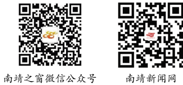
南靖之窗微信公众号