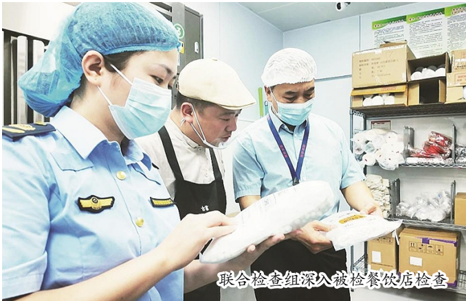
联合检查组深入被检餐饮店检查

本报讯(记者 吴靖 文/图)近日,南靖县市场监督管理局开展 2025 年食品安全“你点我检”工作,并根据网上投票结果,对公众投票数量靠前的 10 家经营单位进行抽检。