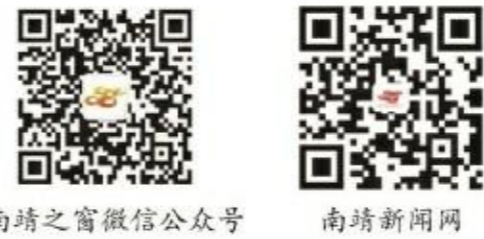
南靖之窗微信公众号