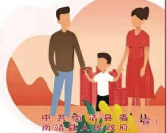
中共南靖县委 南靖县人民政府

社会主义核心价值观： 富强 民主 文明 和谐 自由 平等 公正 法治 爱国 敬业 诚信 友善