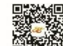
南靖之窗微信公众账号