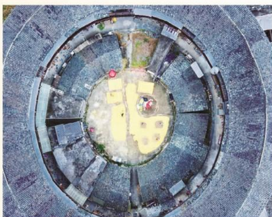
圆圆的土楼,暖暖的日子。