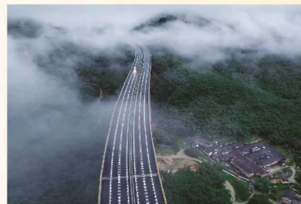
伸出大手,热忱迎接远方客人;沿着康庄大道奔向远方,前进的车轮声就是欢快的音符。