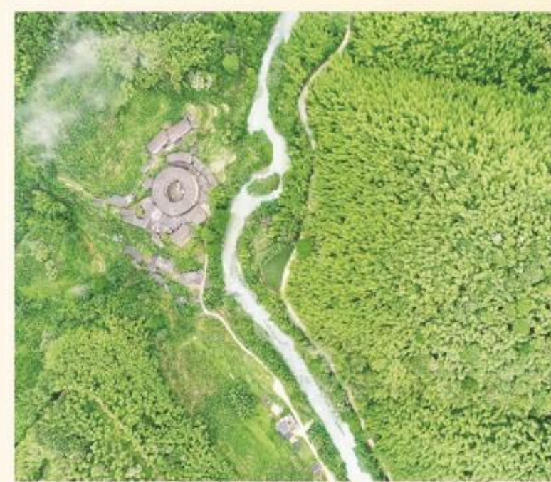
在树海竹洋中停下脚步,在绿色的怀抱里深呼吸,人间快意,何过如此?