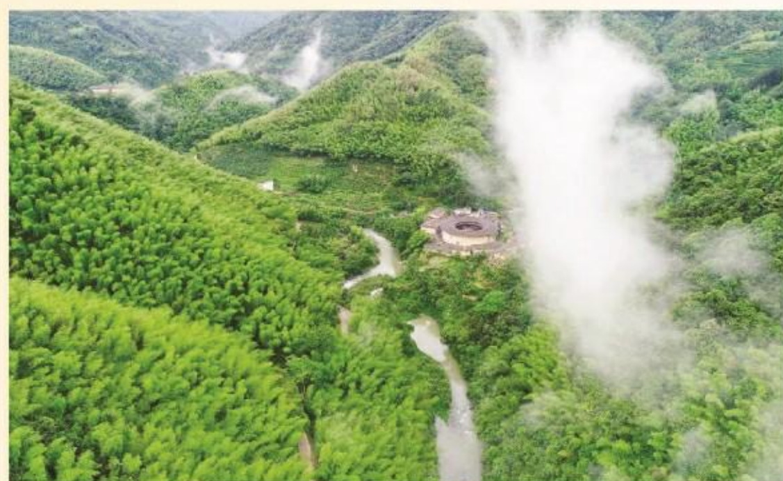
青山绿水蓝天下,白云生处有人家。你的家,我的家,我们魂牵梦绕的家。