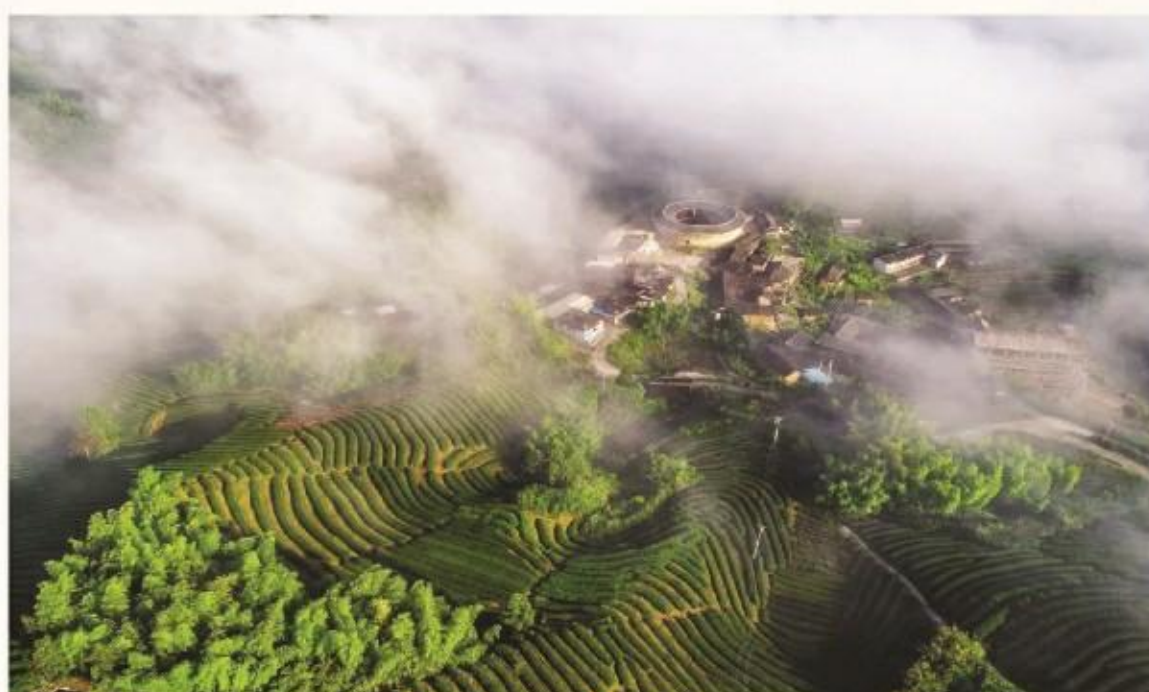
若问神仙哪里住,定有人,指引您来南靖,到这远离尘嚣的地方。