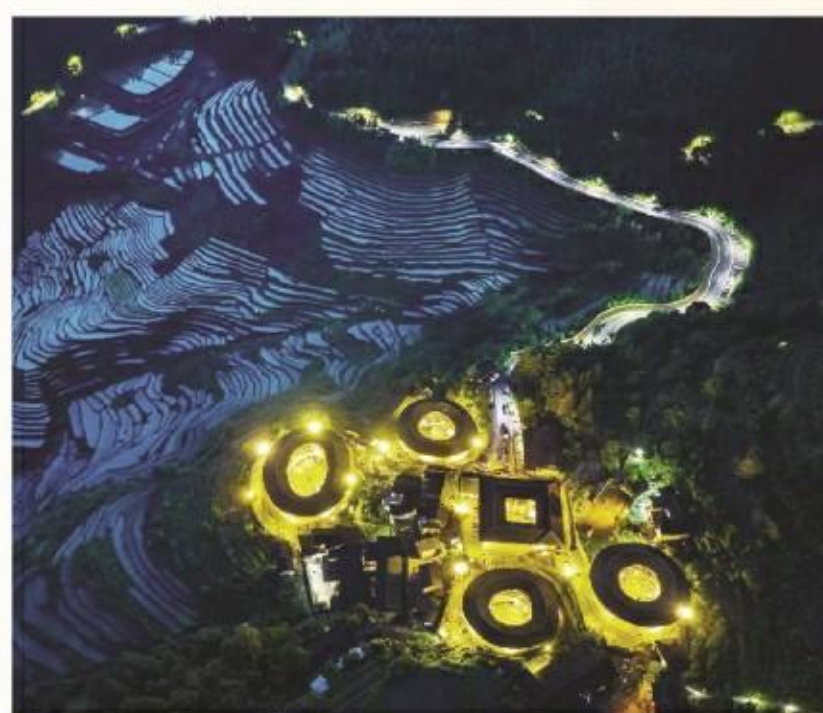
天街夜色凉如水,人间福地暖如春。