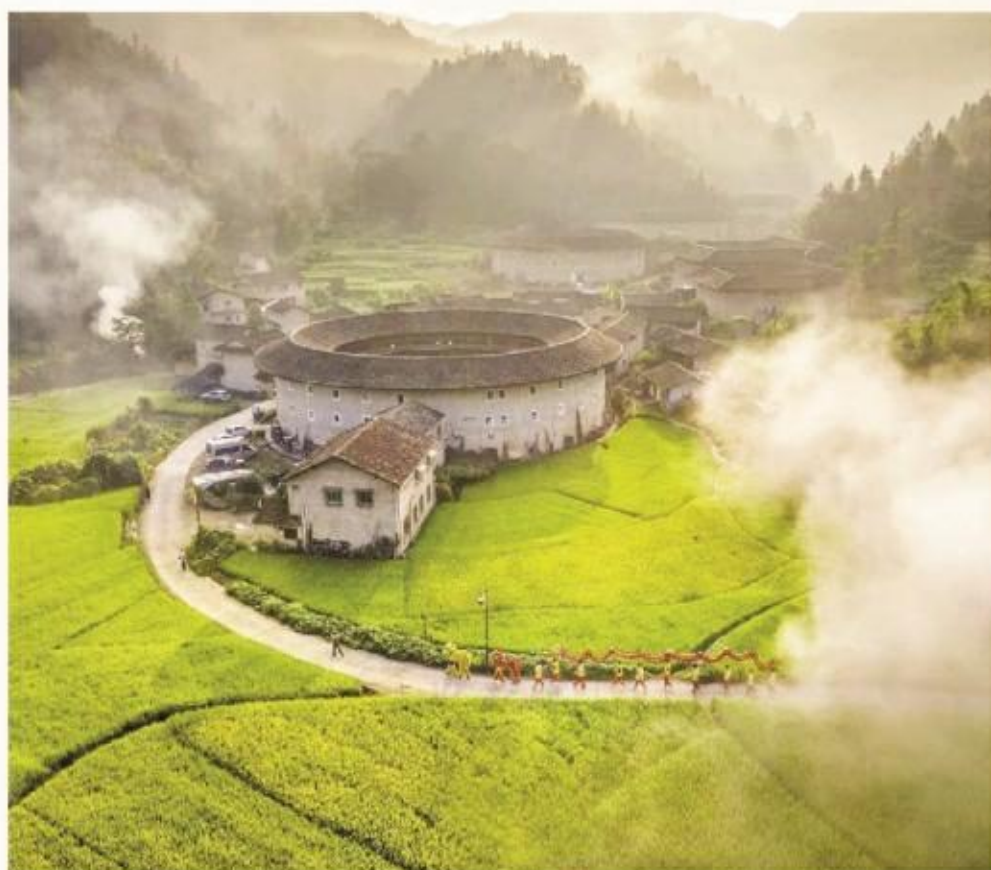
现实版的桃花源,心灵休憩的一方净土。