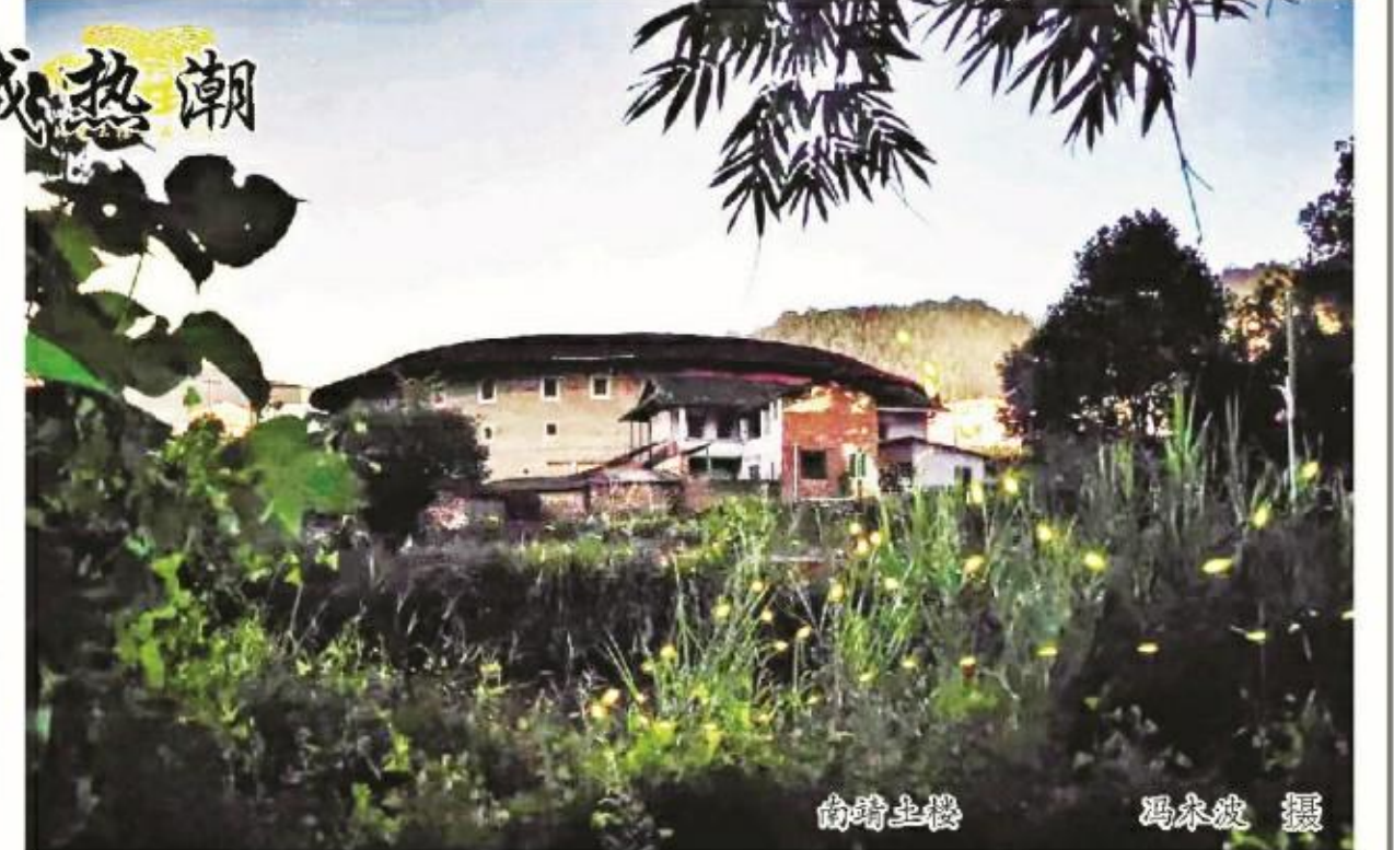
南靖土楼

本报讯(记者 余祥龙 韩佳琪)每年一到夏季,土楼景区塔下村便迎来了萤火虫观赏季。 得益于得天独厚的生态条件,近几年来,南靖土楼景区成了萤火虫的栖息地。每年7月到8月底,一到夜晚,成群的萤火虫便会从树叶间、草丛中钻出来。它们结伴飞行,荧光闪闪,呈现出绚丽的景观。 游客们说:“小时候经常看到萤火虫的画面,但是现在在城市里面住,已经很久都看不到了。这次过来看到漫天的萤火虫觉得非常浪漫。” 据了解,萤火虫是鞘翅目萤科昆虫的通称,是一种小型甲虫。全世界萤火虫有2000多种,它们最喜欢高温湿润的季节,因此,夏季是萤火虫的最佳观赏季节。 南靖县土楼管委会坎下村支委简淑玲说:“每天晚上7:30-10:00是最佳观赏时间。像坎下村的水稻旁、珠山村的散步道、塔下村,这些都是土楼景区萤火虫最佳观赏点。”