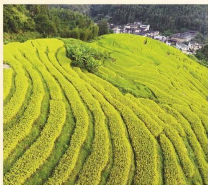
生活是金色的,沐浴着阳光,一层一层往上提。