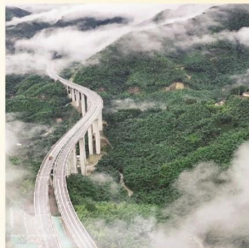
让我走向世界,让世界了解我。过去的心愿,如今的事实,未来的永恒。