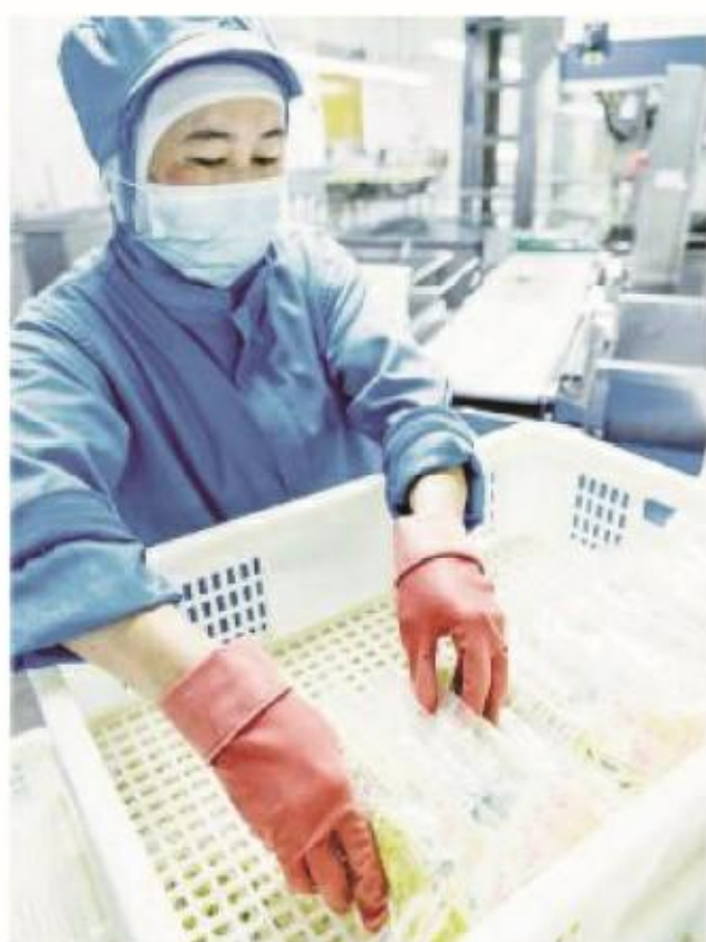
“新鲜出炉”的笋丝产品即将销往日本