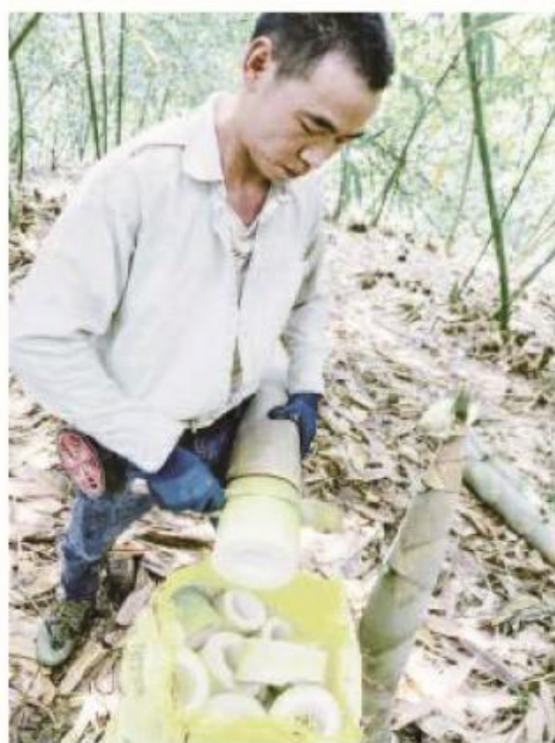
工人将采收的新鲜麻笋去皮切断,便于装袋运输。