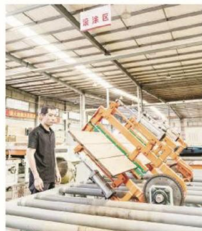
竹制地铺产品在车间的生产线上自动完成涂漆工序