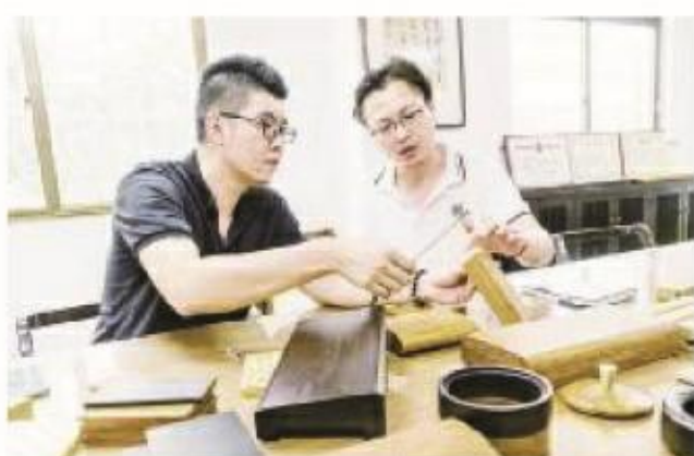
金竹竹业有限公司市场营销工作人员对竹制品样本进行交流探讨