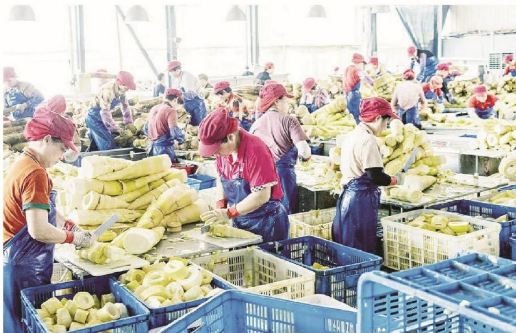
在漳州明成食品有限公司,工人对收购的鲜笋进行初步加工处理。