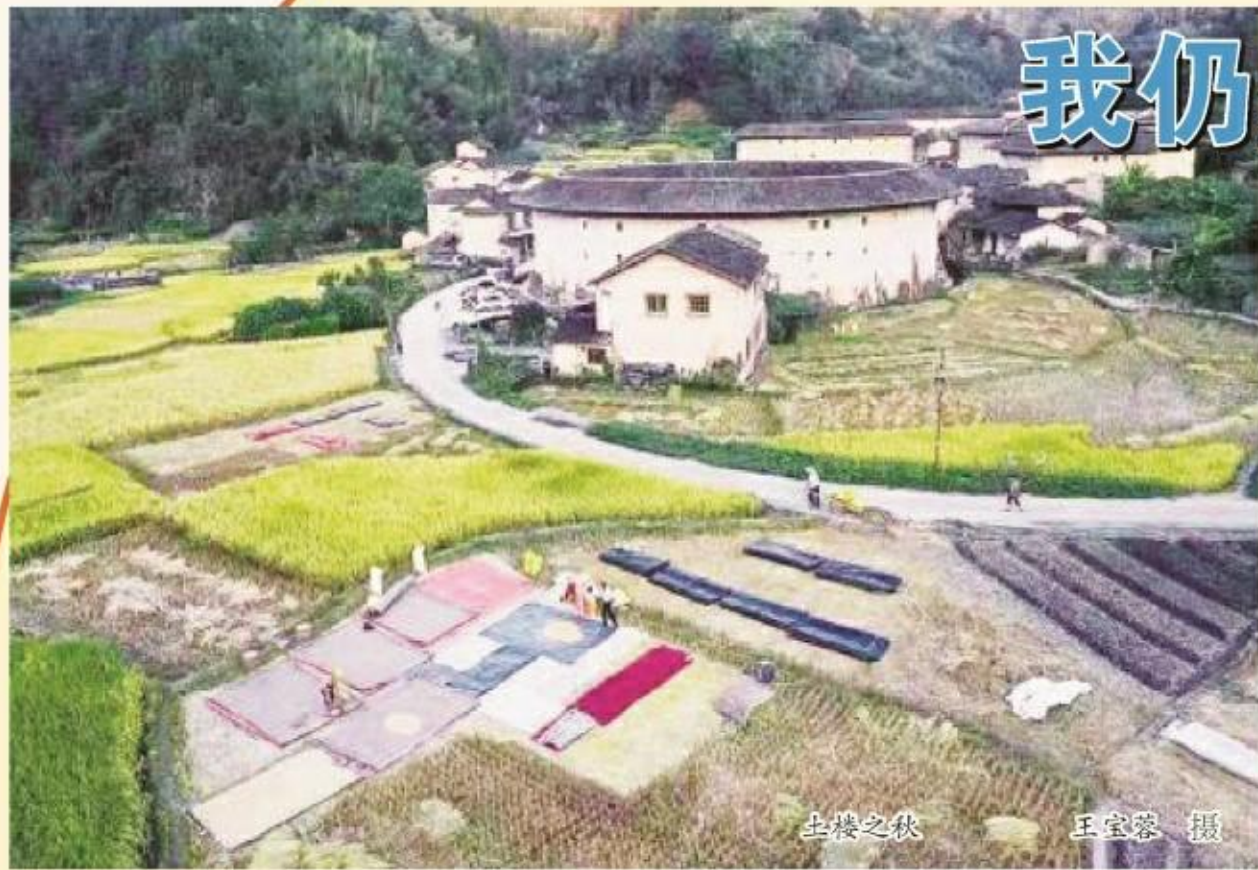
生烟之秋

都市的流萤丽景,我暗藏一枚星火 把夜色吹煮为黎明 生活的沉重,也闪耀着一缕缕光明