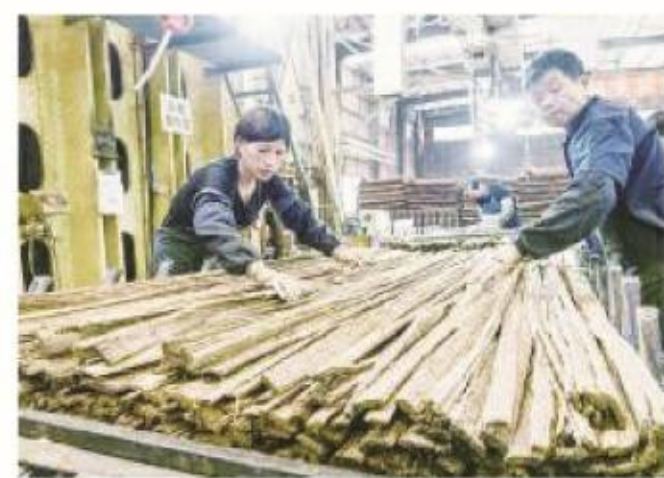
生产车间里,工人正在整理加工后的新型竹质材料。