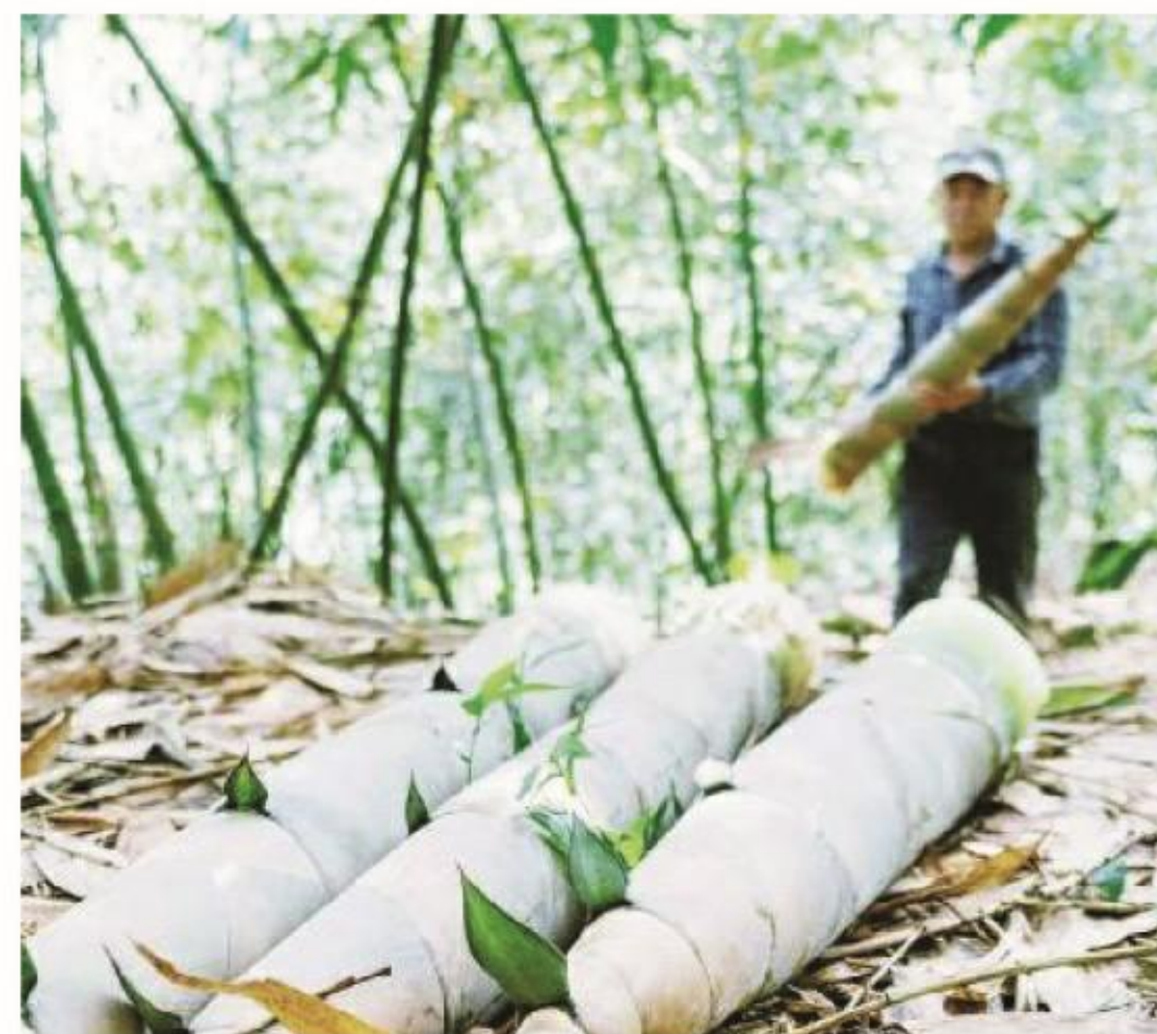
竹林深处,一根根麻笋苍劲挺拔。