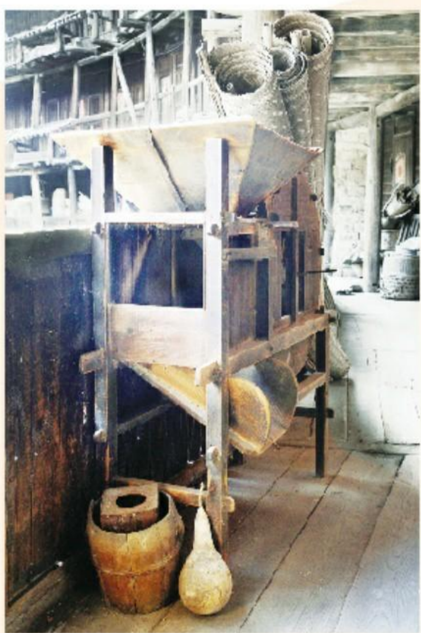
角蕊 米力 摄

那三尺高的讲台 不过抬脚一阶而已 轻轻一跨 便有抑扬顿挫 气壮山河 便有人间奥秘 宇宙万千 而您的灵魂也在一次次毫无保留倾其所有中 迈向了更高的辉煌