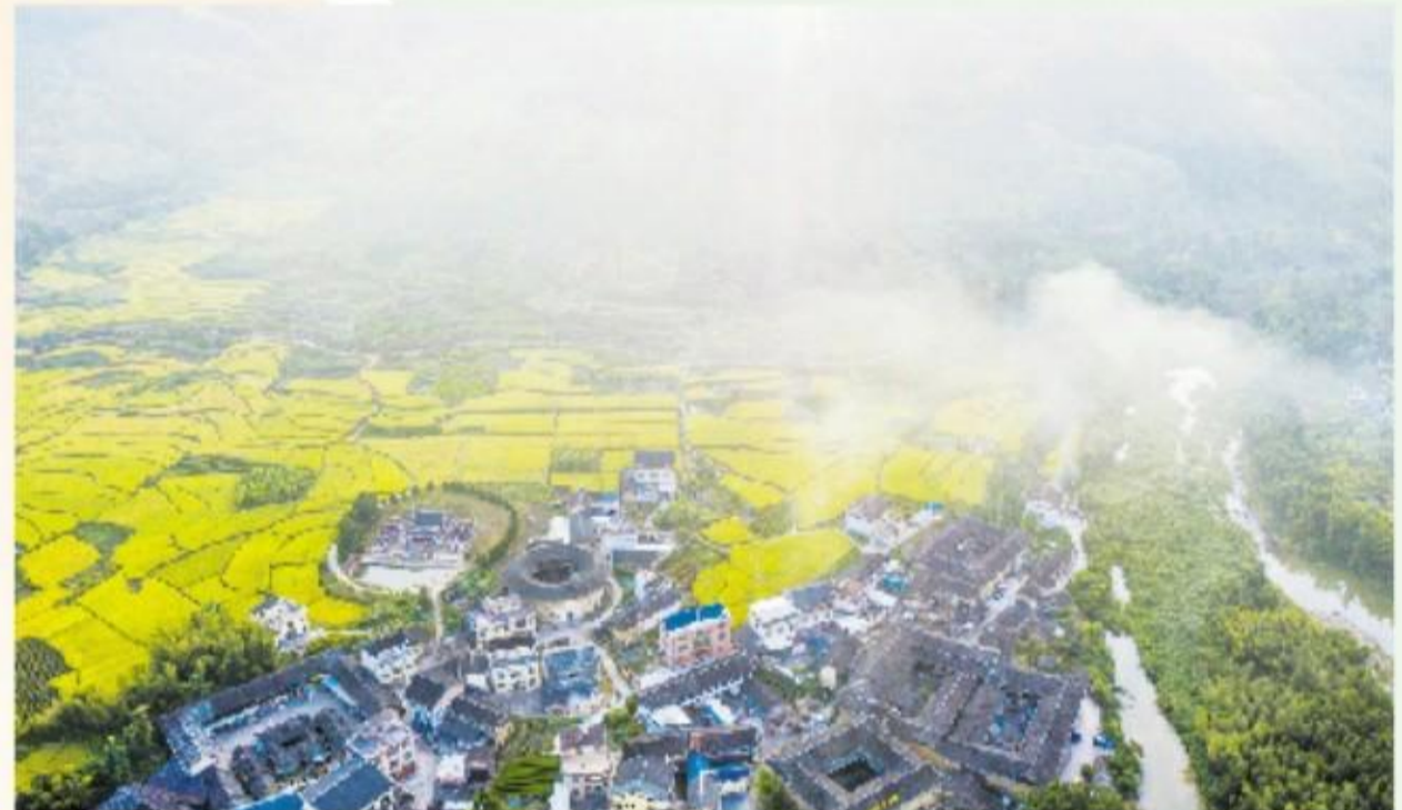
云水涵秋