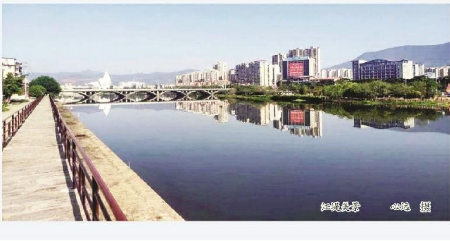
江堤美景

漫步江堤，一步步，又一步步。放眼望去——白鹭，在丛苇间翻飞，是那样地优雅，那样地翩跹；翠鸟，在簇簇苇竿中啼鸣，是那样地清脆，那样地婉转；金阳，更仿佛撒下缕缕金色的渔网，令渔排上“白胖子”的长颈鹭，不时清点着波光粼粼的闪烁河水，再昂首来“咕咕”啼着歌儿欢笑了。就是脚下的蛙鸣与虫响，更似在报暮春的到来。 可不是，野花草草，葱翠翠竹啦；还有一畦畦又一垄垄青菜哩——哪曾想到？一夜的风霜，初阳一普照，又挺起了腰杆来……我的半骨骨折心机生涯，亦如足底下这曾溃塌的堤坝，一遇优政良策，便有了安民之缘，便民之机，抚民之坝；从此，也渐渐舒坦了我的心怀，宽阔了我的精神和精神世界…… 看哪——于此凤凰花木绽放的冬末初春里，远眺高高的凤凰木花开，是那样红艳艳，那样金灿灿……回首几多逝水年华，这奇异的花木，愈是风欺霜冻，绽放得愈精神；愈是皮裂干燥，挺拔得愈得志！就是在干涸的荒漠或盐碱的沙洲，也不闻不问地生长着！再还有什么？什么能比得上她的神情、气爽与伟岸！ 漫步江堤，我一步一履地前行着。瞅着四周绿荫荫的景象，赏着眼前满目花开的盛景，闻着远近翠鸟的啼鸣，以及——许多知名与不知名，丝丝缕缕的啁啾声……几许不