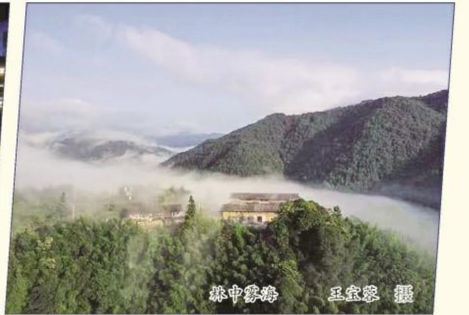
暮中静吟