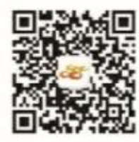
南靖之窗微信公众账号