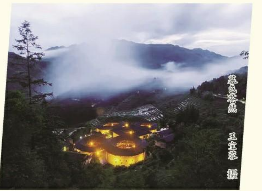
夜色撩人