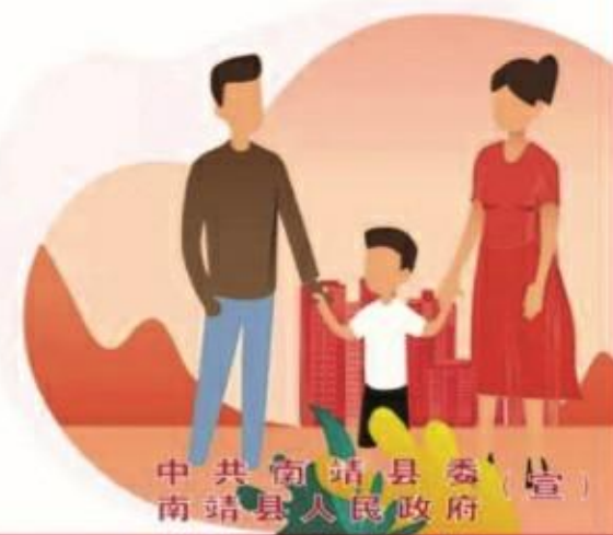
中共南靖县委 南靖县人民政府 宣

社会主义核心价值观：富强 民主 文明 和谐 自由 平等 公正 法治 爱国 敬业 诚信 友善