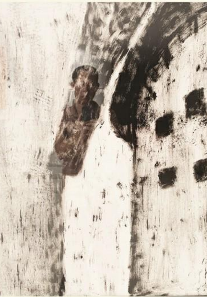
《土楼小景》版画 吴凡