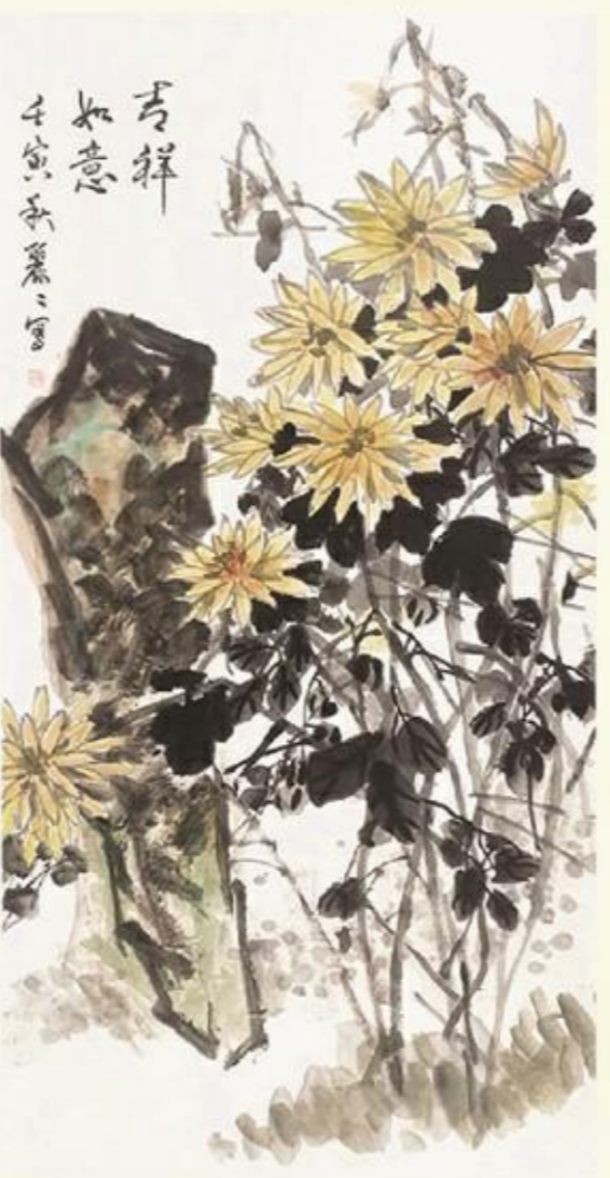
《吉祥如意》国画 魏丽丽