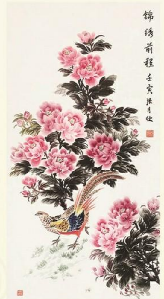
《锦绣前程》国画 张月欣