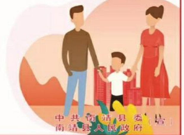
中共南靖县委 南靖县人民政府 宣

社会主义核心价值观： 富强 民主 文明 和谐 自由 平等 公正 法治 爱国 敬业 诚信 友善