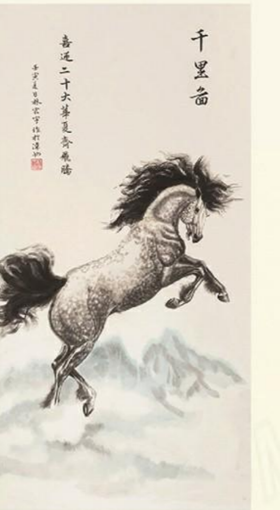
《千里图》国画 林宏宇