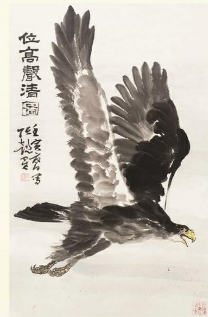
《翱翔图》国画 张懿星