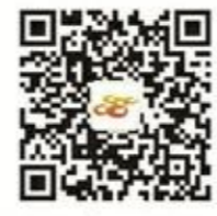
南靖之窗微信公众号