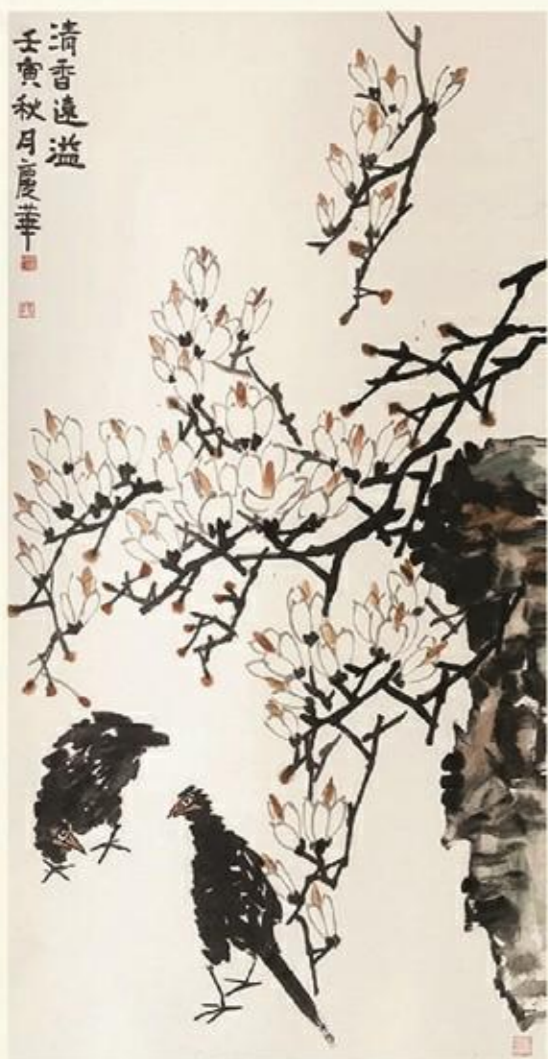
《清香远溢》国画 张庆华