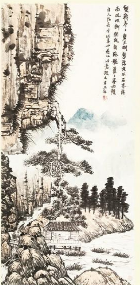
《卧听雨声》国画 吴阳