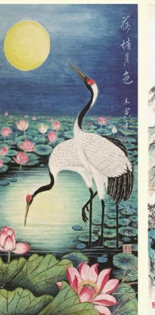
《荷塘月色》国画 陆仰东