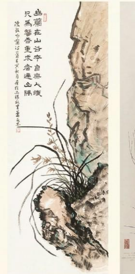
《幽兰在山谷》国画 肖友忠