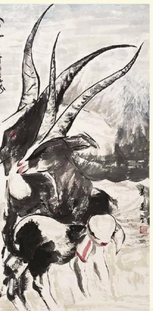
《三羊开泰》国画 黄连斌