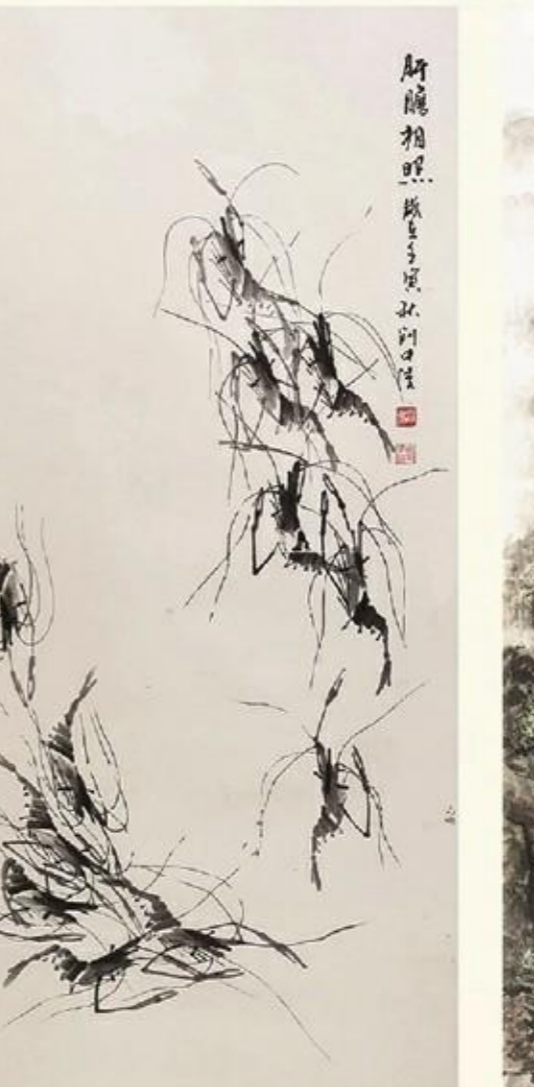
《肝胆相照》国画 刘中陵