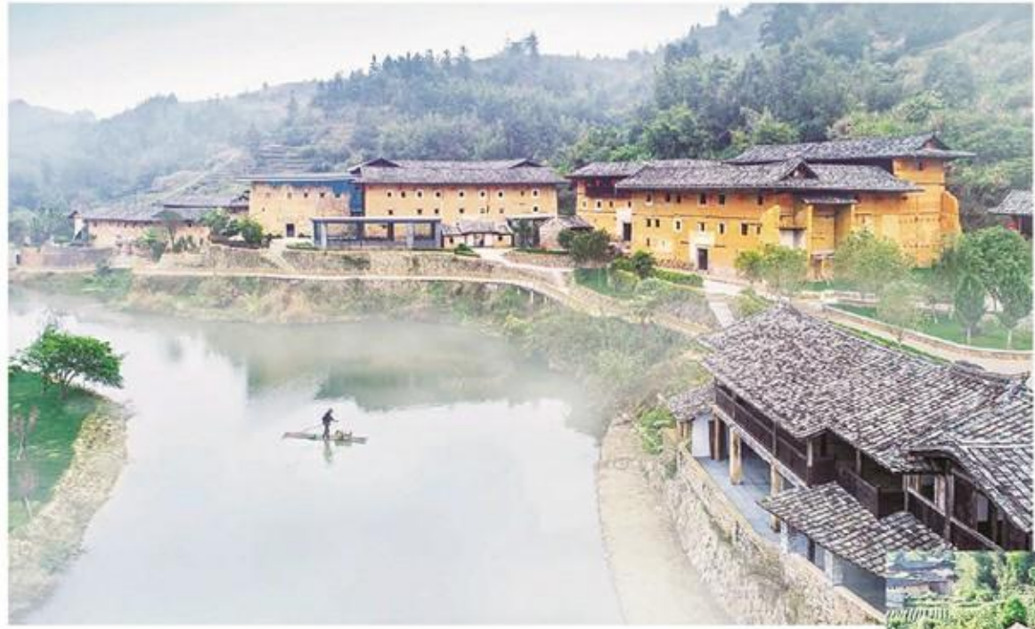
近日,田中赋景区成功创建国家 AAA 级旅游景区。