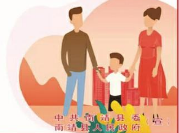
中共南靖县委 南靖县人民政府

社会主义核心价值观： 富强 民主 文明 和谐 自由 平等 公正 法治 爱国 敬业 诚信 友善