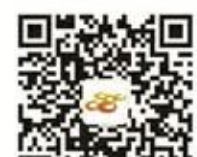
南靖之窗微信公众号