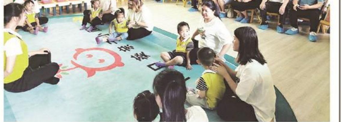
县计生协系统儿童早期发展项目建设。

此次活动,是南靖县计生协儿童早期发展“1+3+x”新模式运行过程中的重要活动,将有效推进南靖县儿童早期发展工作提质增效。