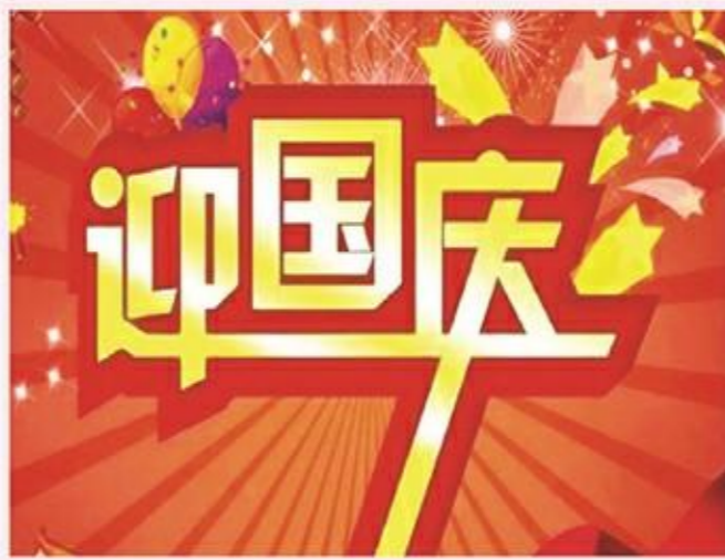
县第二实验幼儿园

在重阳佳节到来之际,县实验幼儿园还邀请退休教师欢聚一堂,欣赏精彩的文艺演出。活动的最后,萌娃们还带来温馨的表演与亲手制作的小礼物,祝福奶奶们节日安康。