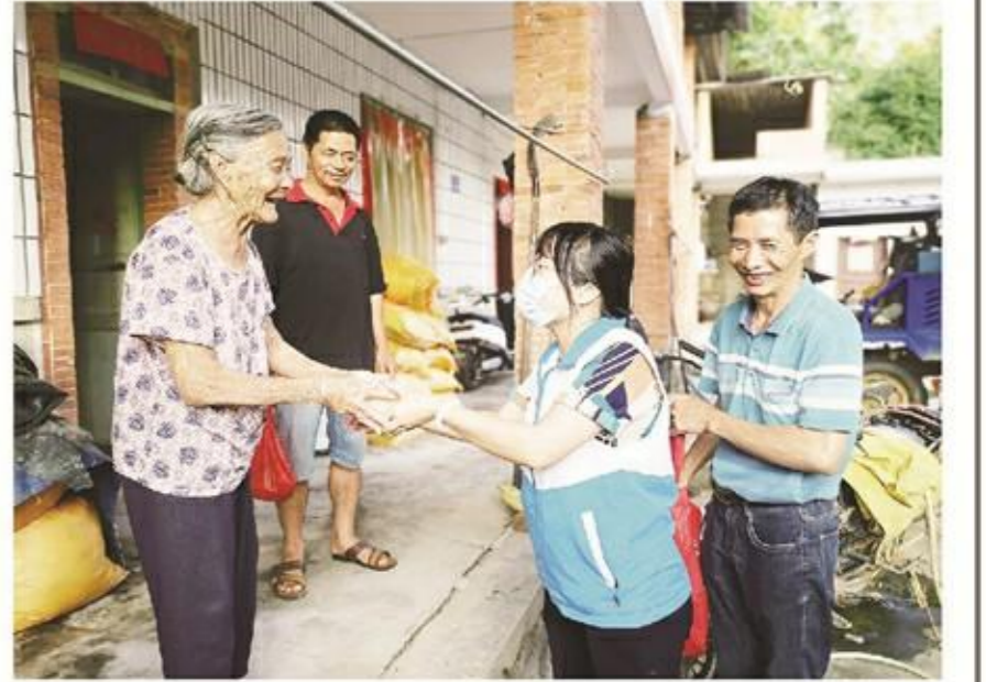
龙山镇还召开离退休干部职工重阳节座谈会。

活动最后,由村志愿者们煮平安面给老人们享用。此次活动中,增进了村里老年朋友之间的互动交流,营造了快乐、和谐的节日气氛。