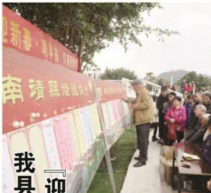
为营造新春欢乐祥和的节日氛围,2月5日,我在滨江公园开展2022年“迎新春·享福”灯谜竞猜活动,吸引了不少灯谜爱好者参与竞猜。

“目前整个园区内,只有40%左右的樱花盛开,花期还有10多天。现在正在盛开的是香水樱,接下去半个月以后盛开的