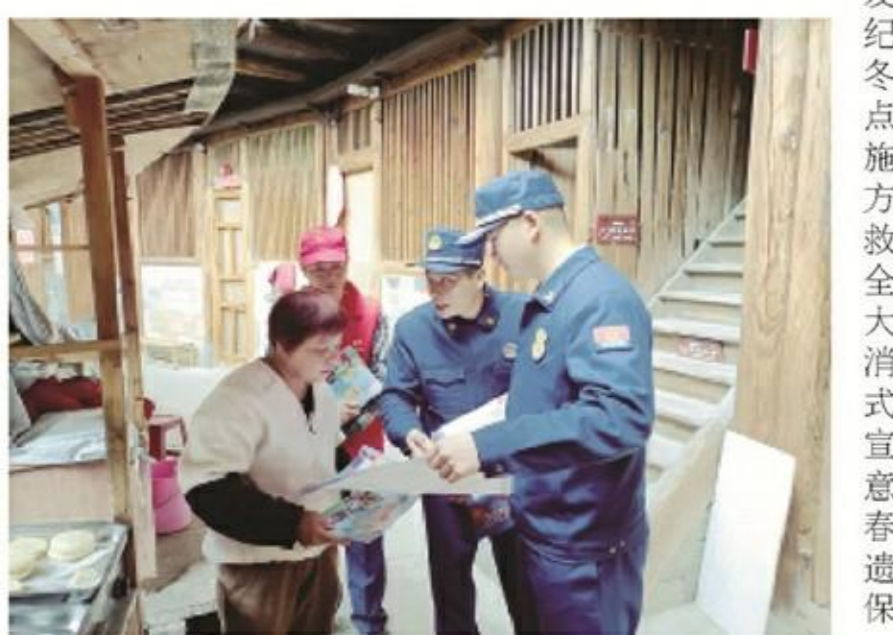
活动中,消防队员走村入户向群众发放消防海报和纪念品,结合辖区冬春火灾防控特点,普及防火扑救方法、火场逃生自救技能等消防安全知识。南靖消防大队土楼站通过消防队员走访的方式开展消防安全宣传,让消防安全意识深入人心,为春节期间的“世遗”土楼消防安全保驾护航。

本报讯(记者 张梦帆 通讯员 黄艺琴 文/图)近日,南靖消防大队土楼站组织消防队员到辖区开展消防安全宣传活动,旨在进一步做好火灾防控工作,提高群众消防安全意识。