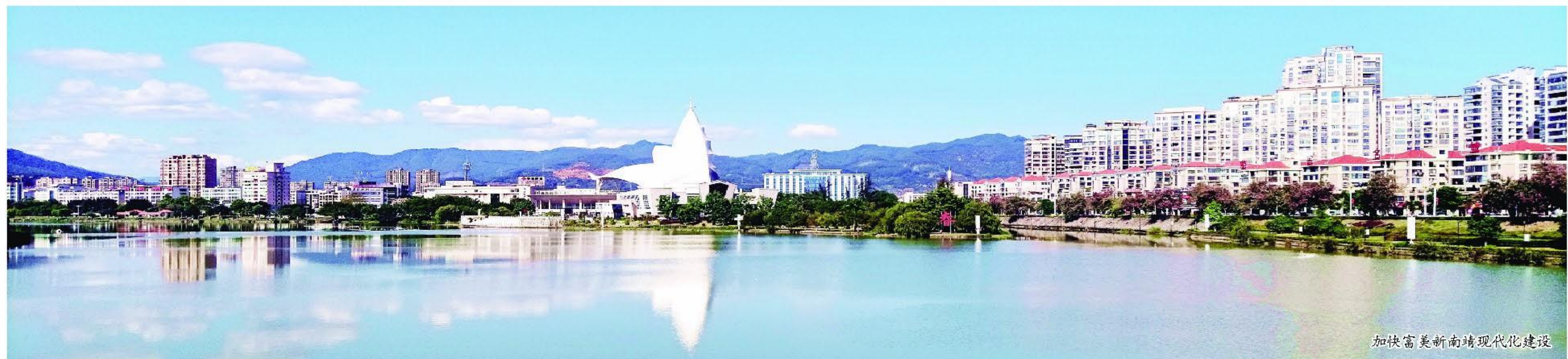
加快富美新南靖现代化建设