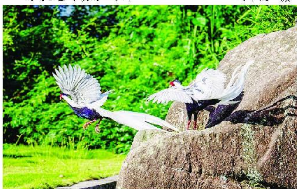
在南靖县金山镇鹤仙洞,两只白鹤在嬉戏。