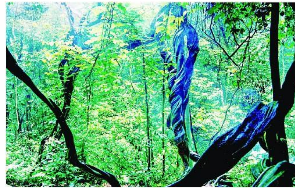
南靖县虎伯寮国家级自然保护区内亚洲第一藤——密花豆藤

良好的生态环境是最普惠的民生福祉。南靖县委、县政府按照“八个公园连一体、八大片区齐发力”的思路,建设城东郊野公园、荆江生态园等城市生态景观工程,打造荆江两岸“一江八园”的风景园林格局,绘就“诗画南靖”;先后投入30多亿元,加强生态治理力度,完善污水处理设施,垃圾收集转运设施等基础设施建设,实现南靖城乡垃圾、污水收集处理率分别达98.1%和89.7%;全面实施能耗强度、碳排放强度和能源消费总量控制,积极开展整县屋顶分布式光伏开发试点工作;全力推动县域内畜禽养殖废弃物零排放、全消纳,实现95%的畜禽养殖废弃物资源化利用,治理模式被国家农业农村部确定为全国十大模式之一,成为全国现场观摩活动参观点之一。