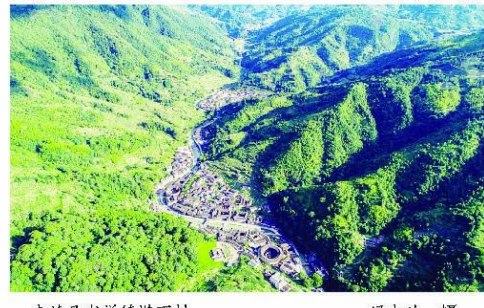
南靖县书洋镇塔下村