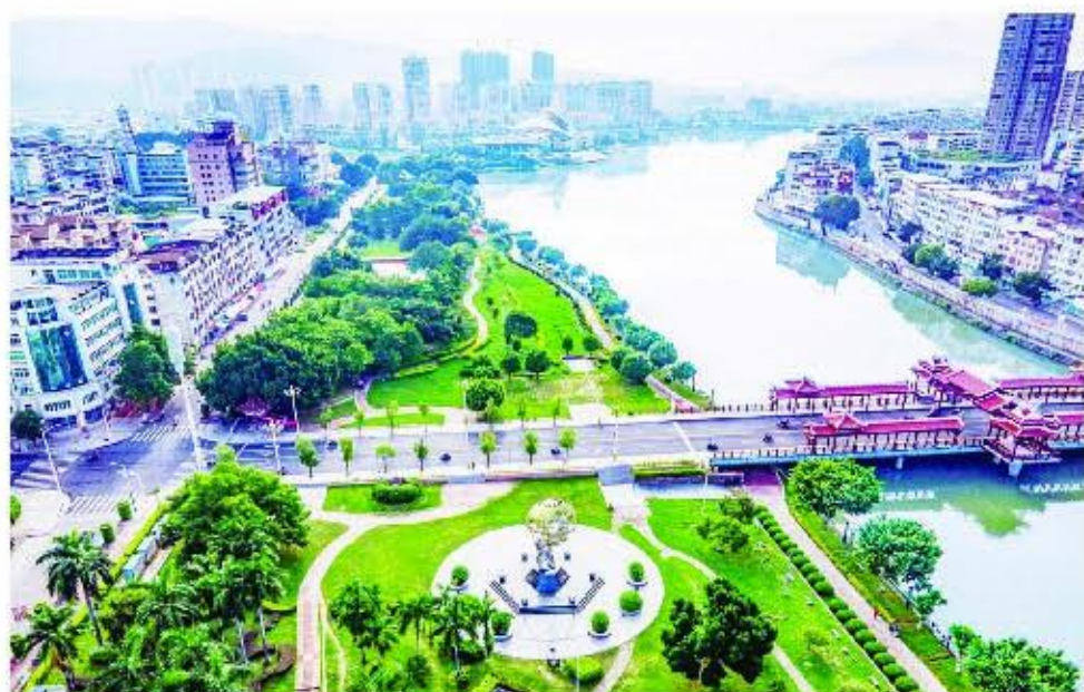
为南靖打造荆江两岸“一江八园”的风景园林格局,绘就“诗画南靖”。

核心提示: 近年来,南靖牢固树立“绿水青山就是金山银山”发展理念,大力实施“生态立县”发展战略,以高质量规划布局生态空间,着力提“气质”、净“水质”、升“土质”,环境建设逐年加强,城市基础设施完善,生态环境明显改善,荣获“国家生态文明建设示范区”称号。该县积极探索、创新生态文明建设体制机制,不断深化生态文明建设,打造新时代富美新南靖。