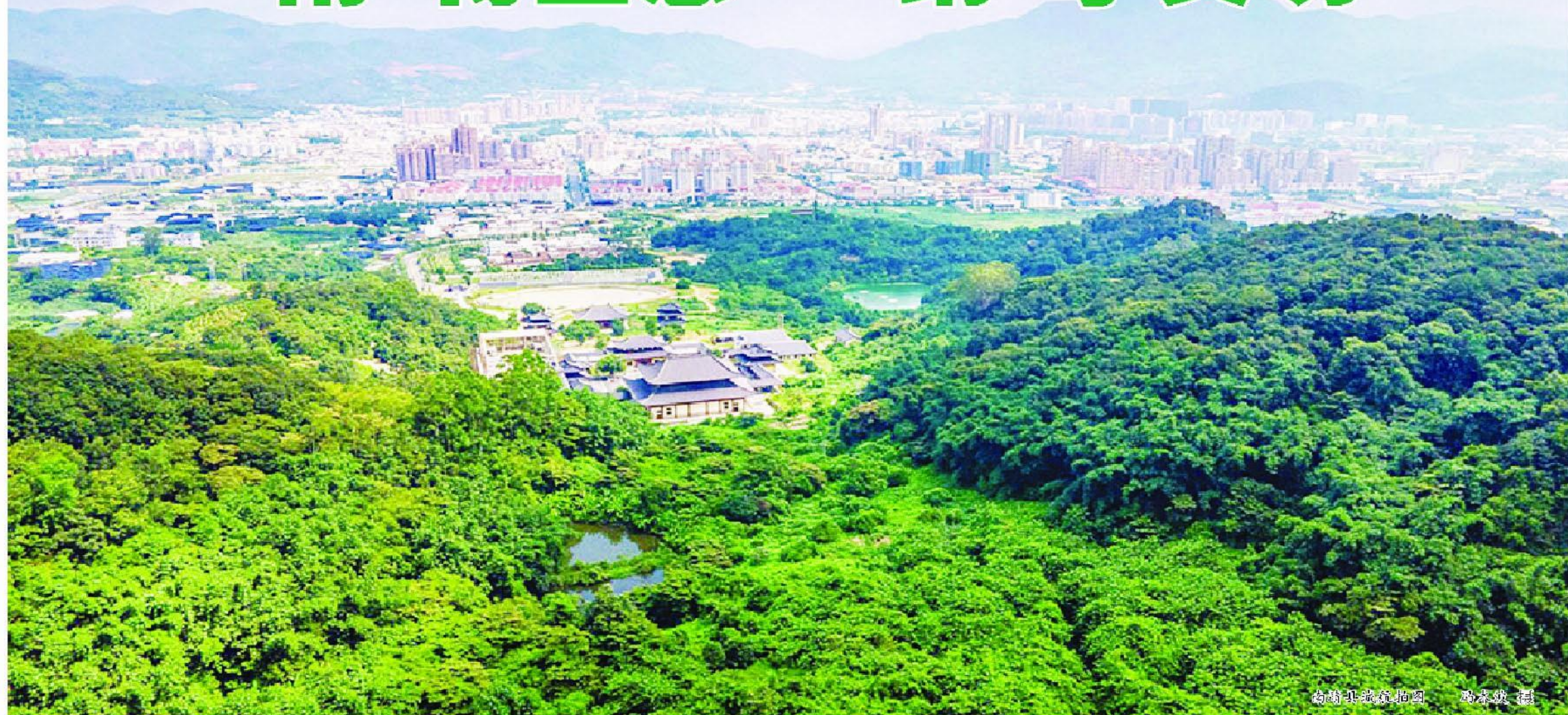
南靖县生态地图

核心提示: 近年来,南靖牢固树立“绿水青山就是金山银山”发展理念,大力实施“生态立县”发展战略,以高质量规划布局生态空间,着力提“气质”、净“水质”、升“土质”,环境建设逐年加强,城市基础设施完善,生态环境明显改善,荣获“国家生态文明建设示范区”称号。该县积极探索、创新生态文明建设体制机制,不断深化生态文明建设,打造新时代富美新南靖。