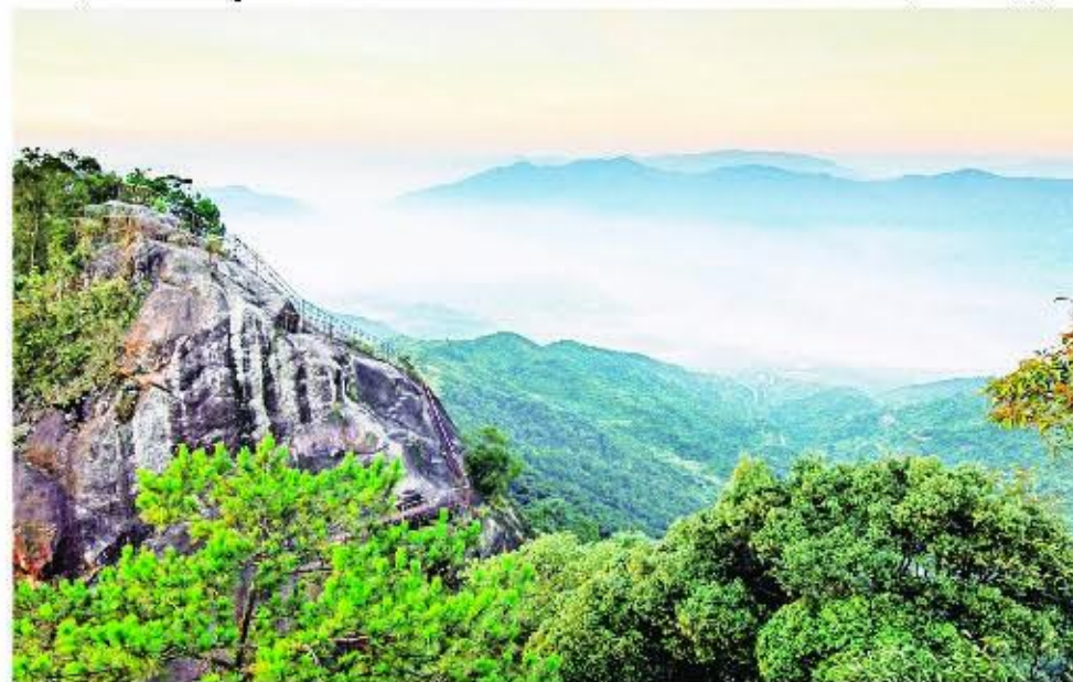
南靖县金山镇鹤仙洞