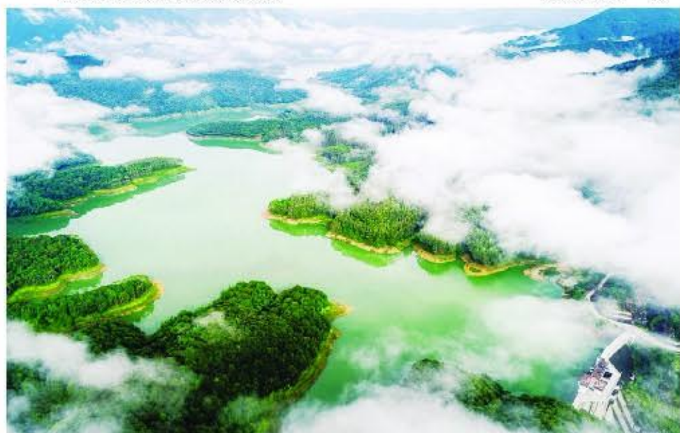
南靖县奎洋镇南一水库