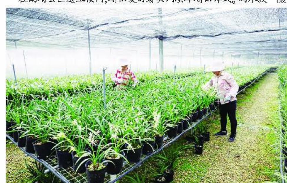
在南靖县兰花园内,村民在打理兰花。