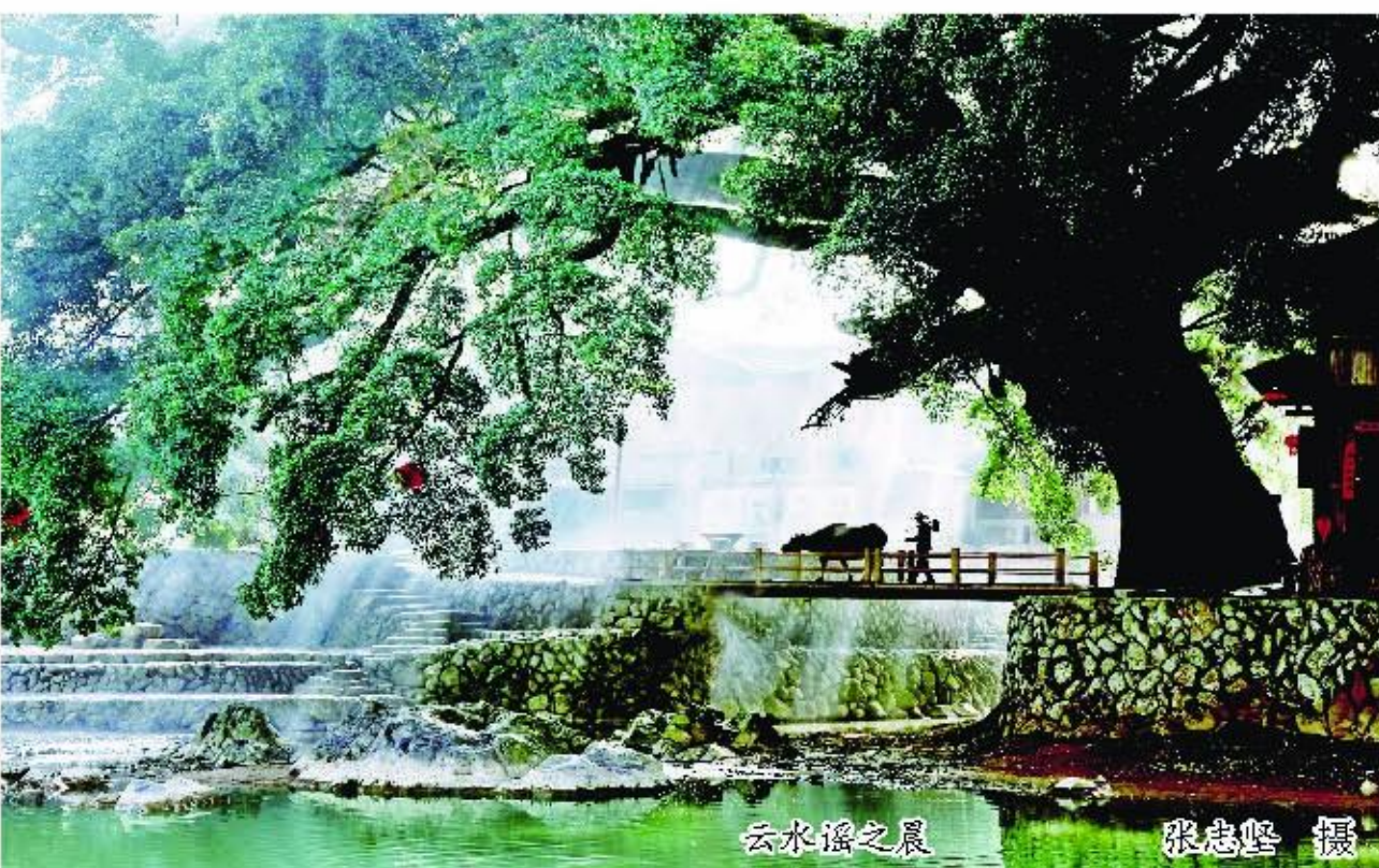
云水谣之晨