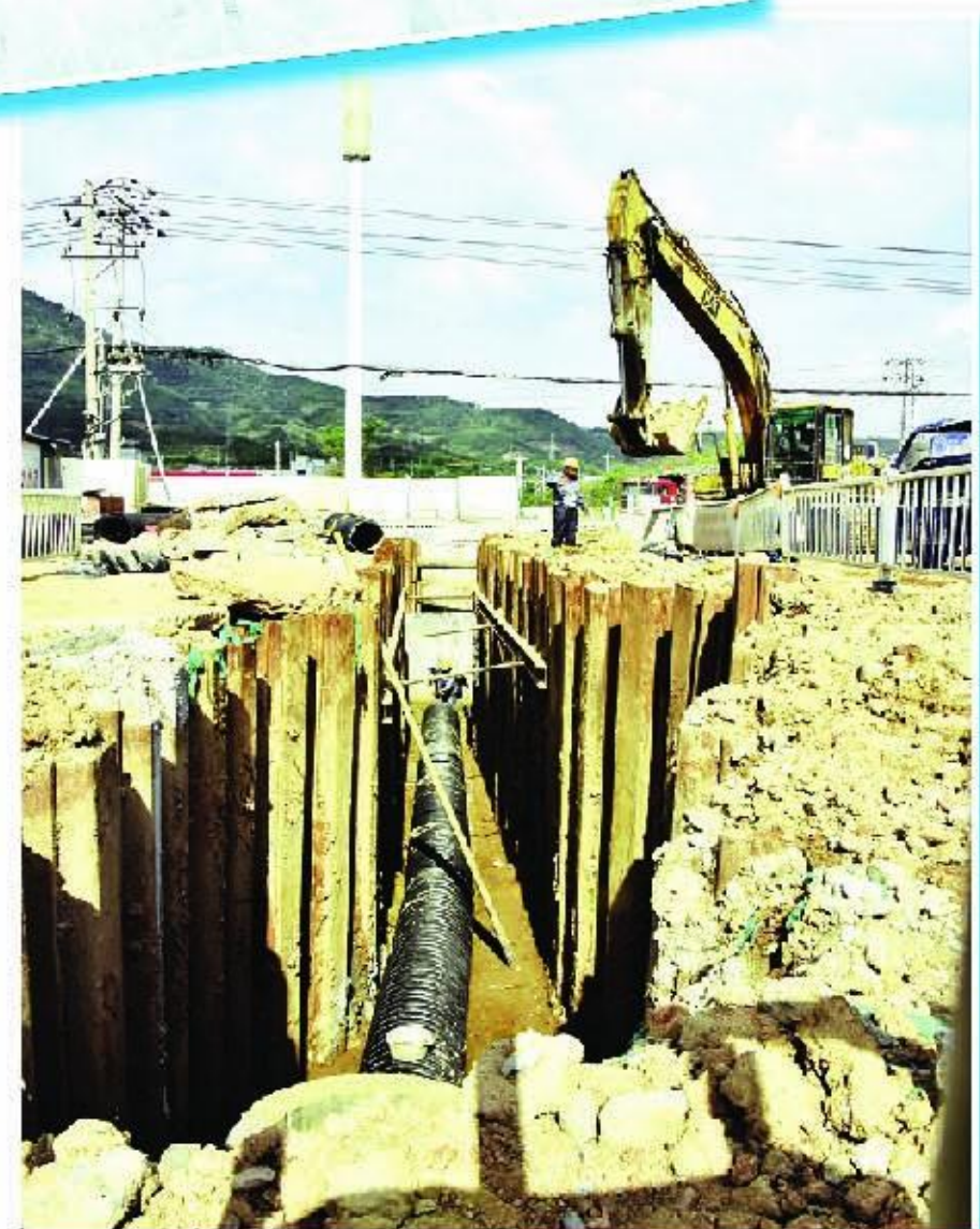
右图:正在施工中的北环路“白改黑”工程是“我为群众办实事”活动之一。