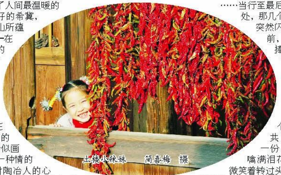
土楼小妹妹