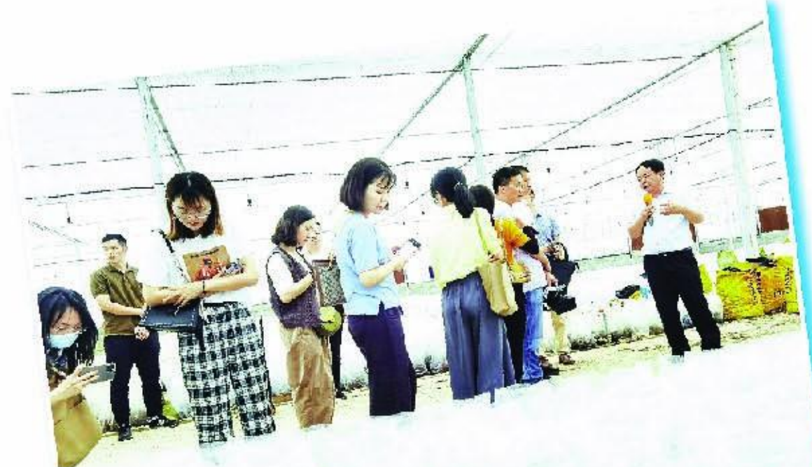
上图:金线莲是南靖县特色农业产业,也是老区镇乡村振兴“助推器”。

“要在党史学习教育中做到学史明理,以明理带动增信、崇德、力行。”南靖县委书记黄劲武表示,南靖要充分发挥“一轴两翼”党史教育基地作用,进一步深化学习、感悟思想,深入宣讲、践行初心,把学习教育中激发出来的工作热情转化为攻坚克难、干事创业的强大动力,以为群众办实事、为发展开新局的实际行动,向党和人民交出一份满意的答卷。 全县各级党员领导干部深入基层、深入群众、深入企业,主动了解社情民意,问政于民,问需于民,问计于民,全力推进“我为群众办实事”“我是党员亮身份”等实践活动深入开展,着力推动解决群众“急难愁盼”等问题。切实把党史学习教育成效体现到为民办实事、解难题上。坚持把党史学习教育同“再学习、再调研、再落实”活动结合起来,解决群众实际问题结合起来。南靖县抓好32件为民办实事和30个补短板项目建设,当前已开工17个,完工4个,完成投资4.19亿元。