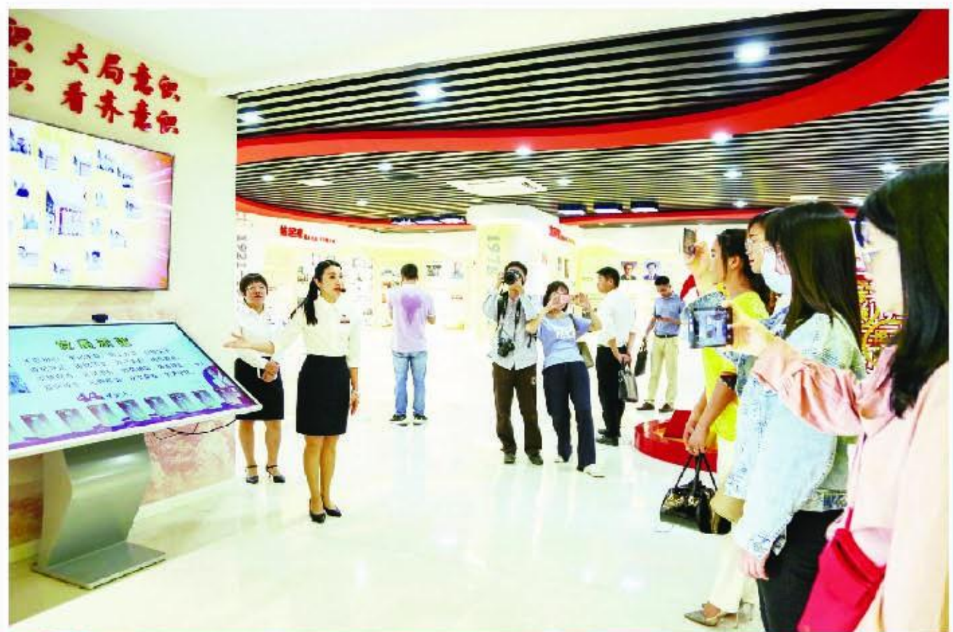
党史教育馆作为目前全市党史系统第一家党史馆,被人民网列为多媒体党建示范案例。