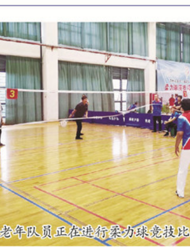
老年队员正在进行柔力球球类比赛。

出考察市场,及时掌握市场动态,并根据客户需求引进新品种。 “目前我种植了四五亩‘亮晶女贞’,这种品种存活率高,好管理,经过两年培育后就可以销售。”陈钦全说,每棵“亮晶女贞”的价格在5000元到2万多元不等。接下来,他还打算到广东引进金叶满天星品种,满足客户的不同需求。 在月明村,到处都种着长势喜人的苗木。据村主任陈国发介绍,从2015年开始,月明村逐渐从传统的、同质化严重的中药材种植,转型为苗木种植。目前,全村约有种植户130户,每年有4000多棵苗木销往浙江、广东、四川、湖北等地。 而随着传统绿化苗木品种销量的稳定,月明村的种植户们也紧跟市场步伐,纷纷寻求新品种,激发种植潜能。同时,当地政府联合青年种植户们多渠道开拓市场,使苗木形成产业链。 如今,苗木已经成为和溪镇的主导产业。目前,全镇苗木种植农户达4000多户,种植面积达2.3万亩。和溪镇还成立了省级南靖漳和花卉苗木专业合作社,投入80多万元建设1200平方米花卉苗木产品展示区,