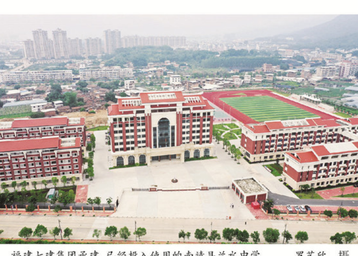
福建七建集团承建,已经投入使用的南靖县兰水中学。

过程中严抓工程管理,确保工程质量。 目前,县城西环路施工段完成并通车使用,北环路预计6月中下旬主干道通车。 而在七建的另一个承建项目——县医院新建病房大楼项目,该项目经理徐林炎正忙着和院方办理新建病房大楼的智能化系统,室内感应系统等移交手续。 徐林炎说目前整个项目已经竣工验收完成,目前在给业主办理移交手续,每个专业进行专项移交。 县医院新建病房大楼项目是2018年县委、县政府为民办实事重点项目,也是2018年我县民生短板攻坚项目。项目主要建设一幢综合病房大楼、连廊及室外附属配套设施等。项目于2019年3月7日开工,于2021年5月15日全部竣工,预计7月份投入使用,将极大改善县城就医条件。 县总医院院长助理张月春说:“项目投入使用后,将新增360张床位,有效提升县域医疗卫生系统的运行效率和服务质量。” 近年来,福建七建集团有限公司