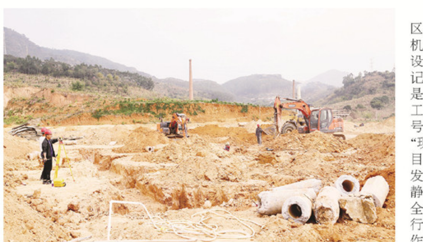
漳州理工职业学院新校区项目实现节后全面复工，施工人员开足马力抢进度，全力推进项目建设。陈智琛 摄

本报讯(记者 林东妹 庄子熙 罗艺欣)连日来，位于靖城镇的漳州理工职业学院新校区项目已实现全面复工，施工人员开足马力抢进度，全力推进项目建设。