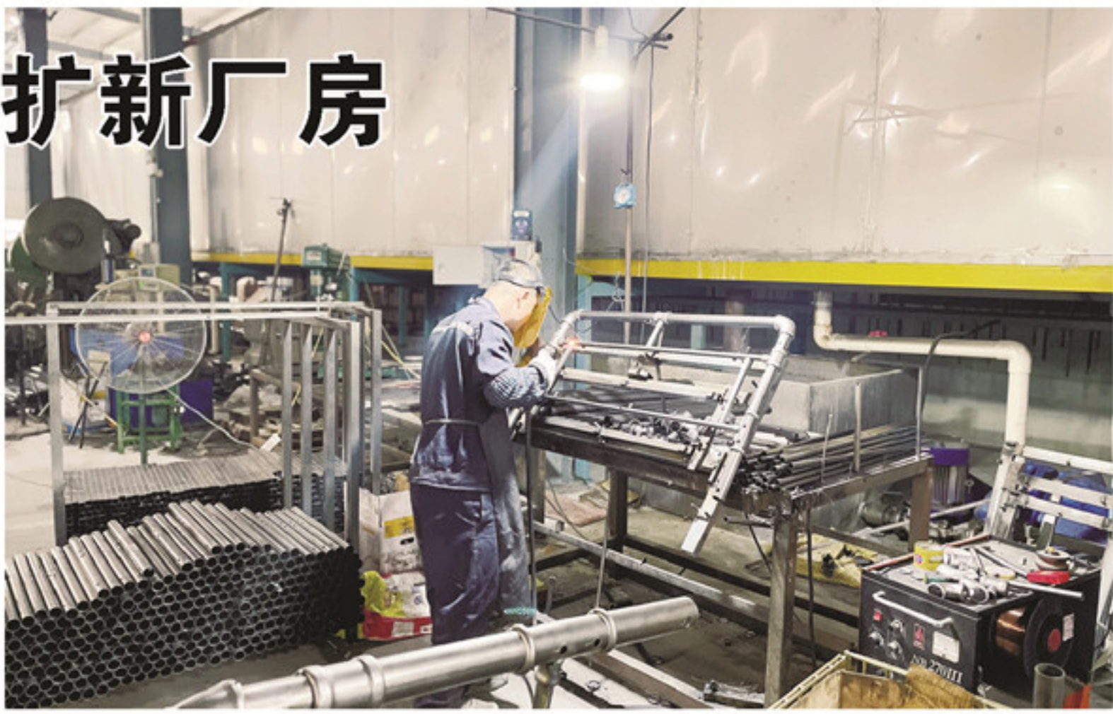
在亿佳兴家具有限公司车间内，工人正在对钢管材料进行焊接。

据了解，亿佳兴家具有限公司总投资5千万元，占地40亩，总建筑面积约40000平方米，主要生产钢管家具，产品远销欧美市场，每年可创产值1.2亿元，创税利1000多万元，解决180名劳动力。