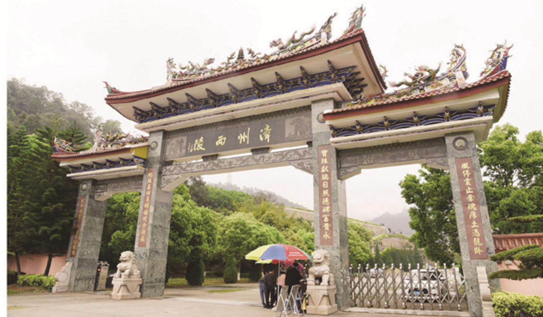
市民在漳州西陵入口处,工作人员正有序引导入园登记。

据了解,漳州西陵清明期间园区将增加窗口,延长服务时间,增加服务人员,与广大群众共同营造安全文明、和谐有序、绿色环保的祭扫新风尚。