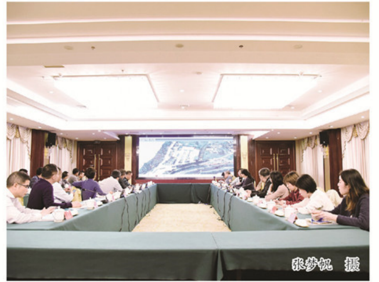
璞山村建设品质提升方案汇报会。

调，要聚焦重点，解决问题。按照省里的部署要求，聚焦“五促一保一防一控”，细化工作方案，解决当前全县重点问题。要结合紧密，整体提升。紧密结合党史学习教育、建党100周年、换届工作及省、市、县相关工作要求，整体上得到提升。要细化内容，从严从实。提前谋划全年“再学习、再调研、再落实”活动工作，超前考虑、细化方案，和省、市工作要求从实对好。要体现成效，精心组织。“再学习、再调研、再落实”活动安排组织要进一步细化方案，调动各职能部门工作力量，抓好贯彻落实，体现出成效。