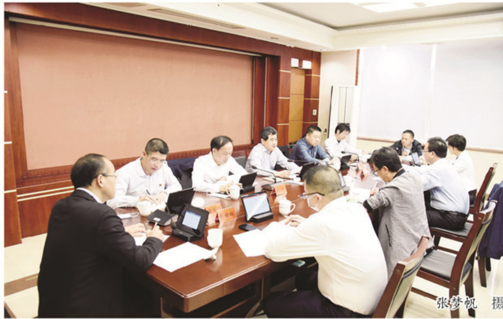
方面工作结合好，推动好，让党史学习教育落到实处。会议传达学习贯彻省委“再学习、再调研、再落实”措施汇报暨重点工作推进交流会主要精神，研究我县开展“再学习、再调研、再落实”活动方案。会议强

调，要聚焦重点，解决问题。按照省里的部署要求，聚焦“五促一保一防一控”，细化工作方案，解决当前全县重点问题。要结合紧密，整体提升。紧密结合党史学习教育、建党100周年、换届工作及省、市、县相关工作要求，整体上得到提升。要细化内容，从严从实。提前谋划全年“再学习、再调研、再落实”活动工作，超前考虑、细化方案，和省、市工作要求从实对好。要体现成效，精心组织。“再学习、再调研、再落实”活动安排组织要进一步细化方案，调动各职能部门工作力量，抓好贯彻落实，体现出成效。