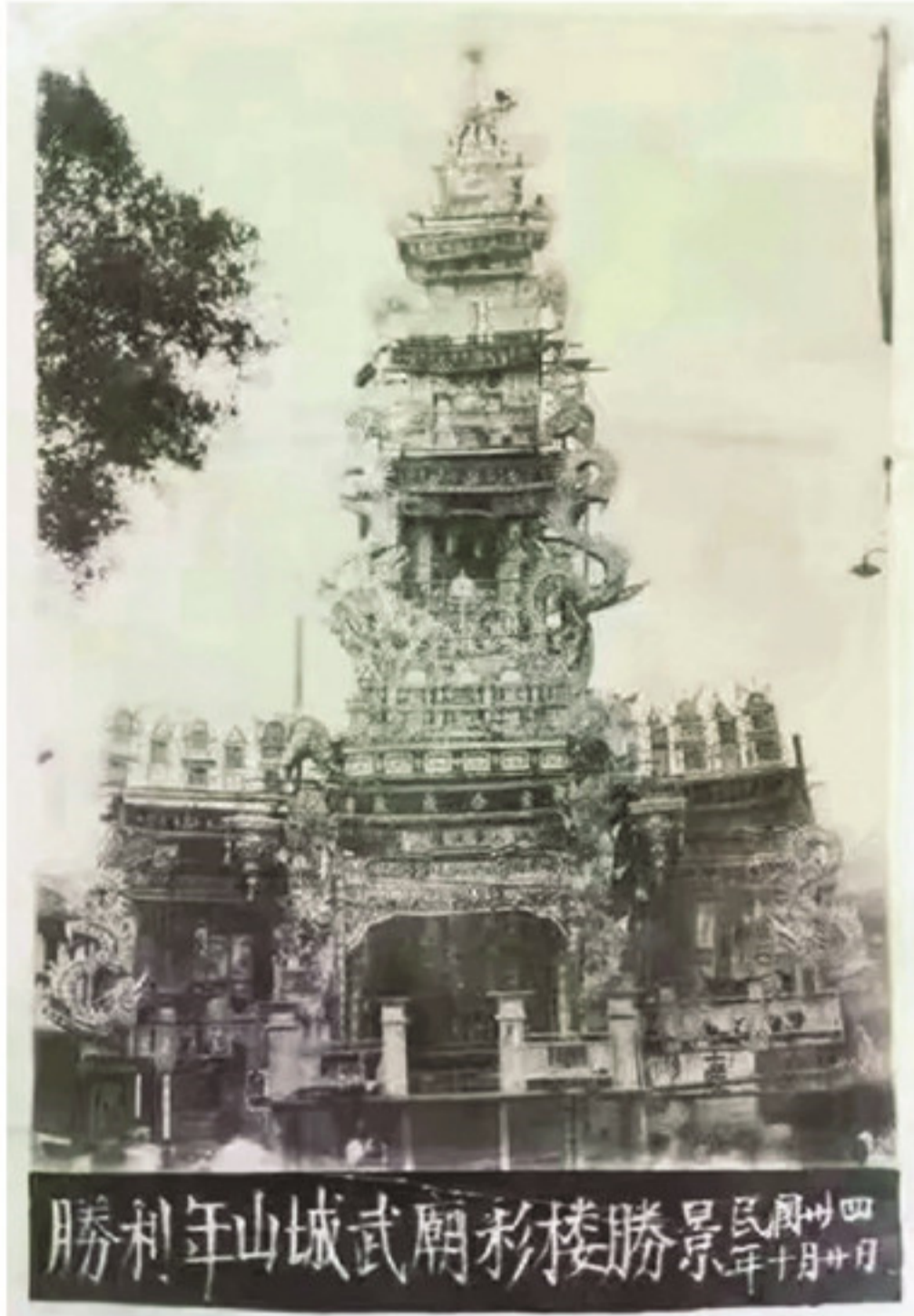
1945年,南靖山城武庙结彩楼。

彩楼一般放置几月便拆除。结彩楼不仅是民众对美好生活的祈愿,更是民间一项不可多得的艺术财富。