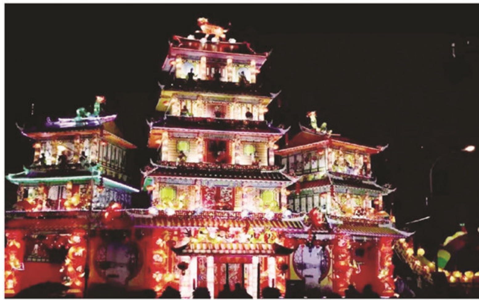
2017年,南靖山城硕兴庙结彩楼。

闽南各地每逢神诞或“三朝清醮”“五朝王醮”等其他重要日子,常常举行“结彩楼”的传