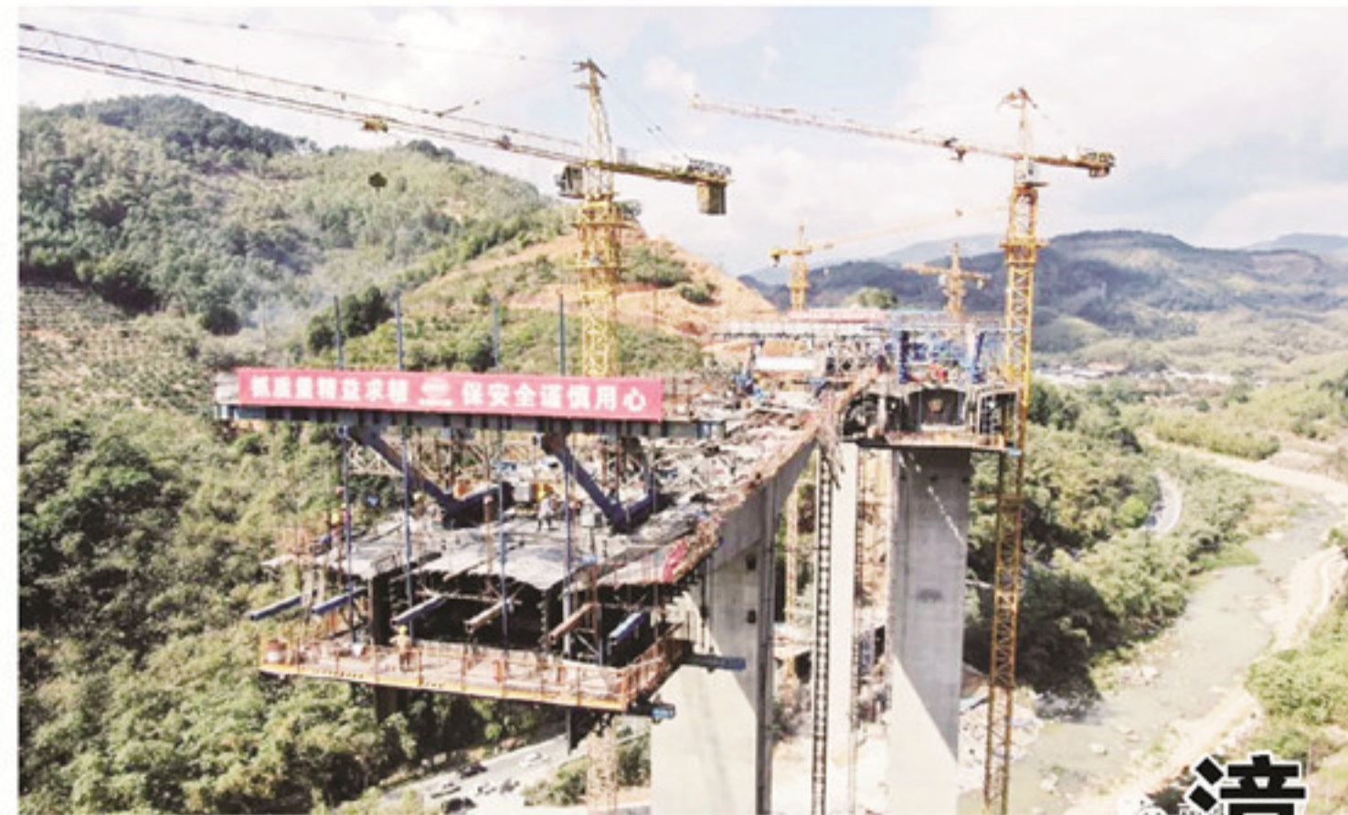
漳武高速公路南靖段A2标段建设者正在对世禄4号大桥左幅11号墩6号段进行施工,现场一片繁忙。

2020年,景区共签约项目9个,总投资达48.65亿元,签约项目落地率约70%。据了解,2021年将新建云水谣商业综合体及停车场项目,总建筑面积为15920平方米,新增停车位416个,以“旅游+产业”的文化经营理念,对沿街传统建筑的外观颜色及装修风格进行统一,打造云水谣景区网红目的地和休闲地。“做好景区项目建设工作任重道远且势在必行,在提升景区内外部条件的同时站在游客角度多思考多研究,进一步促进景区休闲度假游的发展,真正将景区打造成引领文旅转型升级的排头兵,助推南靖土楼景区发展超越新引擎、新亮点。”南靖县土楼党工委副书记、土楼管委会主任刘永盛说道,“南靖土楼景区的‘大宴’正逐渐摆好,只待宾朋‘入席’。”